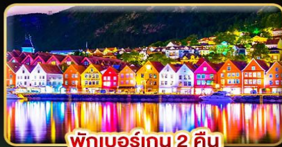
พักเบอร์เกน 2 คืน