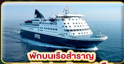
พักผ่อนเรือสำราญ แบบ Window Room 1 คืน