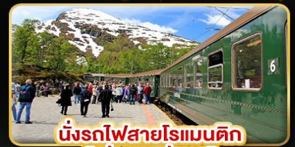
นั่งรถไฟสายโรแมนติก "ฟรอมสพาน่า"