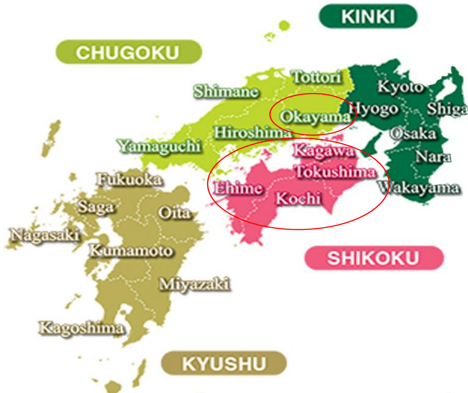
จังหวัด คางาวะ (KAGAWA) ตั้งอยู่บนเกาะชิโกกุ (SHIKOKU) 1 ใน 4 เกาะหลักของญี่ปุ่น