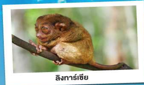
ลึงทาร์เซีย

21-24 ก.พ. 68 28 ก.พ.-03 มี.ค. 68 07-10, 14-17 มี.ค. 68 21-24, 28-31 มี.ค. 68 04-07 เม.ย. 68 (วันจักรี) 11-14 เม.ย. 68 (วันสงกรานต์) 18-21, 25-28 เม.ย. 68