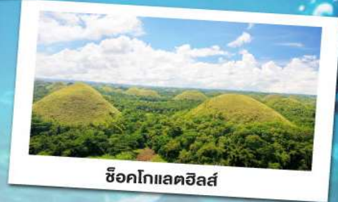
ซ็อคโกแลตฮิลล์