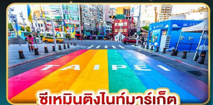
ซีเหมินติงไนท์มาร์เก็ต