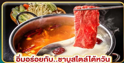
อิ่มอร่อยกับ..ชาบูสไตส์ไต้หวัน เมนูหม้อนึ่งจักรพรรดิ เสียวหลงเป่า

ช้อปปิ้งใจ..ตลาดซีเหมินติง ตลาดโจงจ้งไนท์มาร์เก็ต ตลาดเหลาเหอไนท์มาร์เก็ต