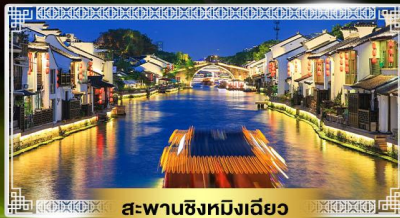
สะพานชิงหิงเฉียว