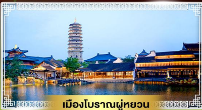
เมืองโบราณฝูหยวน