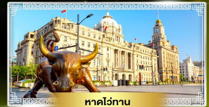
หาดไว่ถาน