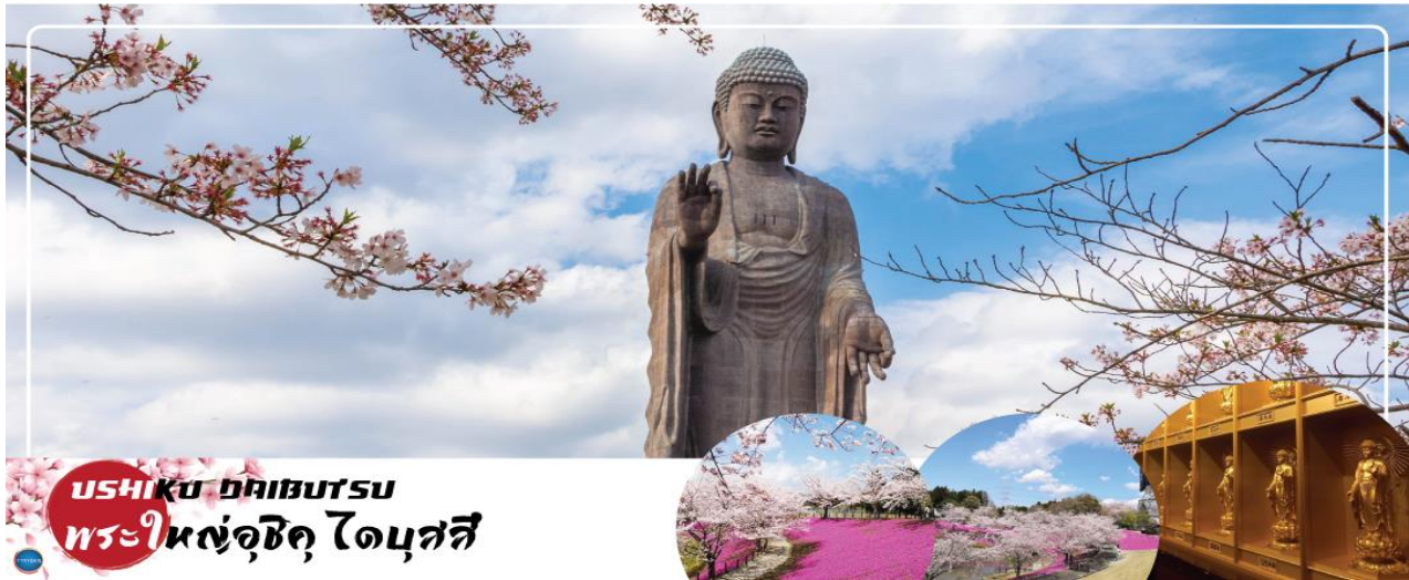
USHIKU ไดบุสึ พระใหญ่อุซึคุ ไดบุสึ