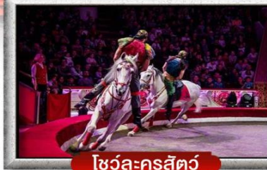
โชว์ละครสัตว์