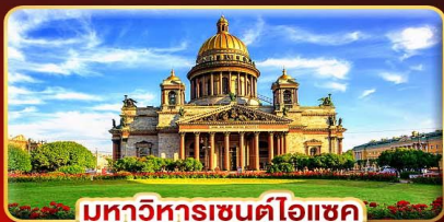
มหาวิหารเซนต์ไอแซค

เดินทาง : 21-28 มี.ค.68 | 07-14 เม.ย.68 28 เม.ย.-05 พ.ค.68