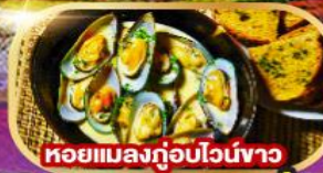
หอยแมลงภู่อบไวน์ขาว