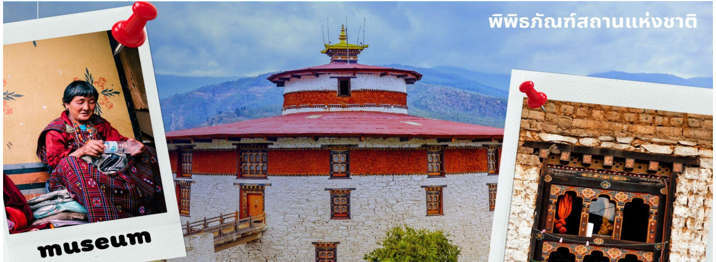
พิพิธภัณฑ์สถานแห่งชาติ

รับประทานอาหารเที่ยง ณ ภัตตาคาร (มื้อที่ 1)