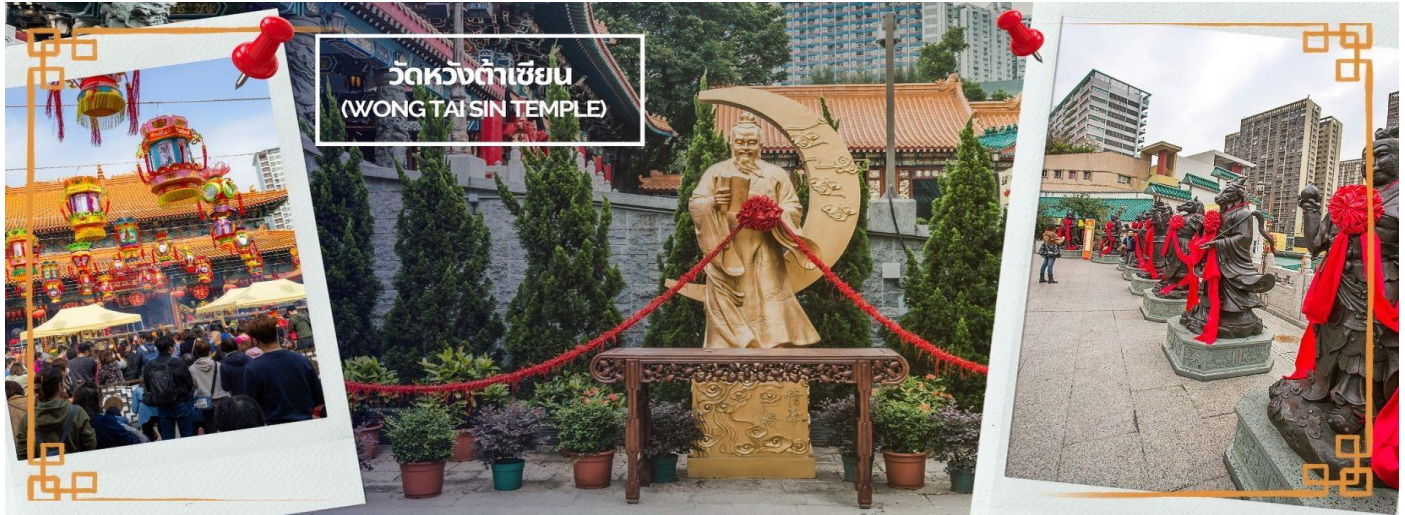
วัดหวังต้าเซียน (WONG TAI SIN TEMPLE)

ภายใต้แสงจันทร์ เป็นเทพเจ้าผู้เป็นอมตะที่อาศัยอยู่บนดวงจันทร์ และลงมาโลกมนุษย์เพื่อผูกด้ายดวงชะตา ระหว่างคู่รักซึ่งเมื่อคู่กันแล้วก็จะไม่แคล้วคลาดกัน