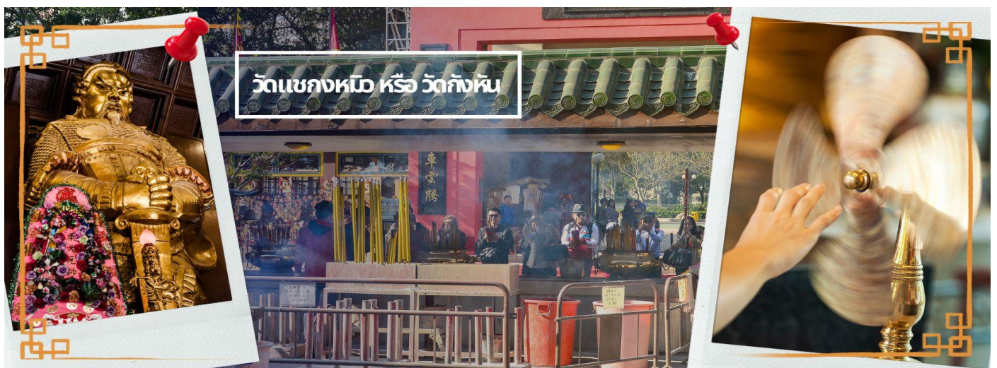
วัดแชกงหมิว หรือ วัดกั๊กหัน

จากนั้นนำท่านเดินทางไป วัดแชกงหมิว หรือ วัดกั๊กหัน (CHE KUNG TEMPLE) วัดแชกงสร้างขึ้นเพื่อเป็นอนุสรณ์เพื่อรำลึกถึงตำนานแห่งนักรบราชวงศ์ซ่ง มีนามว่า “แช กง” แม่ทัพปราบศึก ผู้คนทั่วทุกดินแดนต่างยำเกรงในกำลังพลอันกล้าหาญแข็งแกร่งของแม่ทัพแชกง เป็นวัดเก่าแก่ที่มีความศักดิ์สิทธิ์มาก มีอายุกว่า 300 ปี ตั้งอยู่ในเขต SHATIN มีประวัติเล่าต่อกันมาว่า ขณะที่แม่ทัพปราบศึก อยู่นั้น ทุกแคว้นเขตแดนแผ่นดินใหญ่ต่างก็ยำเกรงต่อกำลังพลที่กล้าหาญในกองทัพของท่าน ยามที่ออกรบเพื่อต้านข้าศึกศัตรูทุกทิศทาง ทุก ๆ ครั้งท่านใช้สัญลักษณ์รูปกั๊กหัน 4 ใบพัดติดไว้ด้านหลังรถศึกนำ ขบวนในกองทัพ เหล่าทหารกล้ามีความเชื่อว่าเมื่อพกพาสัญลักษณ์รูปกั๊กหันนี้ไป ณ ที่ใด ๆ กั๊กหันนี้จะช่วยเสริมสิริมงคล นำพาแต่ความโชคดี มีอำนาจเข้มแข็ง เสริมกำลังใจให้แก่กองทัพของท่าน ชื่อเสียงในการนำทัพสู้ศึกของท่านจึงเป็นตำนานมาจนทุกวันนี้ ปัจจุบันวัดแชกงจึงเป็นสถานที่สักการะเคารพ ขอพร ท่านแชกง โดยมีสัญลักษณ์เป็นกั๊กหันนำโชคนั่นเอง 🕒 การหมูนกั๊กหันนำโชคที่ตั้งอยู่ในวัด เพื่อจะได้หมูนเวียนชีวิตของเราและครอบครัวให้มีความเจริญก้าวหน้าด้านหน้าที่การงาน โชคลาภ ยศศักดิ์ และถ้าหากคนที่ดวงไม่ดีมีเคราะห์ร้ายก็ถือว่าเป็นการช่วยหมูนบัดเป่าเอาสิ่งร้ายและไม่ดีออกไปให้