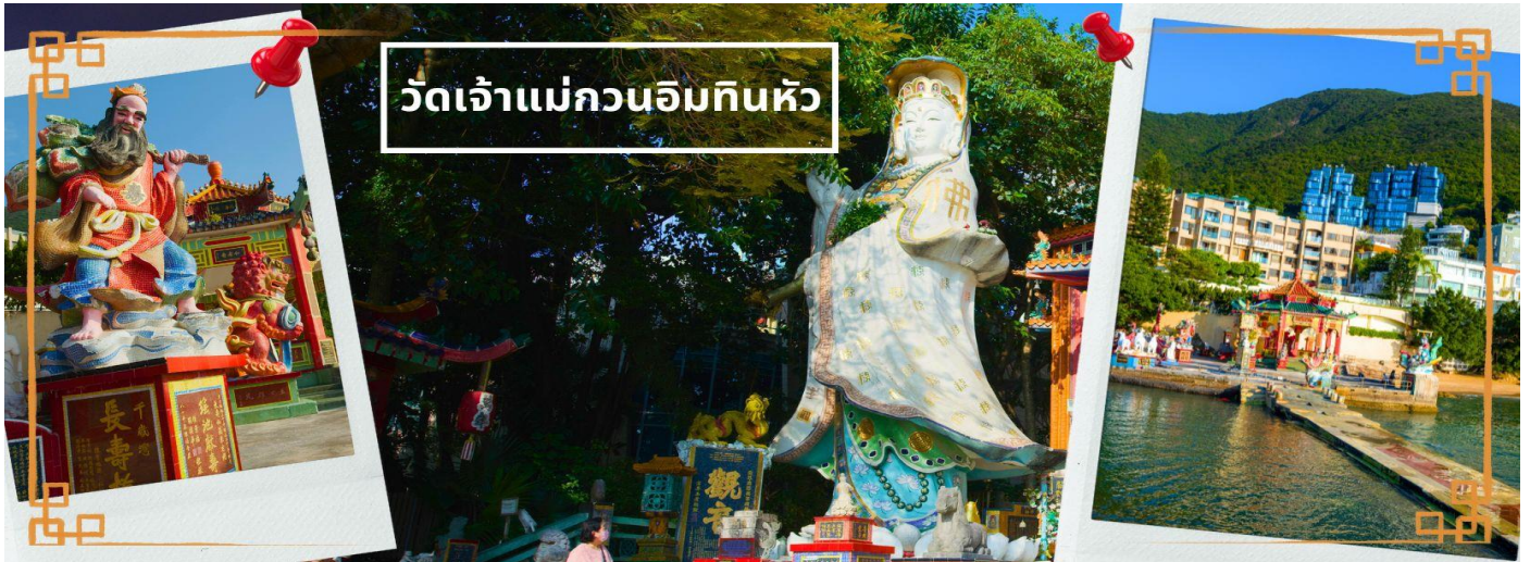
วัดเจ้าแม่กวนอิมทินหัว

จากนั้นนำท่านเดินทางสู่ วัดเจ้าแม่กวนอิมทินหัว อ่าวรีพัลส์เบย์ (TIN HAU TEMPLE REPULSE BAY) ตั้งอยู่ริมทะเล เป็นสถานที่ท่องเที่ยวสำคัญ สร้างขึ้นในปี ค.ศ. 1993 วัดแห่งนี้ถูกสร้างขึ้นเพื่อคุ้มครองชาวประมงในการออกเรือไปหาปลา ซึ่งเป็นหนึ่งในวัดที่เก่าแก่ที่สุดของฮ่องกง บริเวณวัดจะมี เจ้าแม่กวนอิมองค์ใหญ่ ปางประทานพรตั้งอยู่ เป็นเทพที่ชาวฮ่องกงและคนจีนให้ความเคารพนับถือมากที่สุด สามารถขอพรได้ทุกเรื่อง วัดนี้เป็นที่นิยมมีนักท่องเที่ยวเดินทางมาขอพรกันมากมาย เพราะเชื่อในความศักดิ์สิทธิ์ และยังมี เจ้าแม่ทับทิม หรือ เทพธิดาแห่งท้องทะเลองค์ใหญ่ ซึ่งคนฮ่องกง คนมาเก๊า และคนจีน ที่อยู่ริมทะเล ชาวประมง นักเดินเรือหรือผู้ที่เดินทางทางเรือเป็นประจำ จะนับถือเจ้าแม่ทับทิมเป็นอย่างมาก มีความเชื่อว่าเจ้าแม่ทับทิมจะปกป้องเราจากภัยอันตรายระหว่างการเดินทาง ภายในวัดยังมีเทพเจ้าและพระพุทธรูปต่างๆ ประดิษฐานไว้มากมายตามความเชื่อถือศรัทธา เช่น เทพเจ้าไฉ่ซิงเอี้ย ใหญ่ขอโชคลาภความมั่งคั่ง ความร่ำรวย, พระสังกัจจายน์โพธิสัตว์ เทพประทานบุตร-ธิดา ใหญ่ขอโชคลาภลูก, สะพานต่ออายุ (สะพานอายุยืน) สะพานสีแดงตั้งอยู่บนริมหาด สีแดงสด ชาวจีนเชื่อกันว่าหากเดินข้ามสะพานนี้ เราจะมีอายุยืนขึ้นอีก 3 วัน (3 วัน บนสวรรค์ = 3 ปี บนโลกมนุษย์) นั่นหมายความว่า ถ้าเราเดินข้ามสะพานนี้แล้ว จะมีอายุยืนยาวขึ้นอีก 3 ปี บนโลกมนุษย์, เทพเจ้าแห่งความรัก ใหญ่ขอเนื้อคู่, ศาลา 8 เหลี่ยม เชื่อกันว่าเป็นจุดที่มีฮวงจุ้ยดีที่สุด ภายในศาลาแปดเหลี่ยม จุดกึ่งกลางของพื้นจะมีรูปแปดเหลี่ยม ให้เราไปยื่นขอพรจากตำแหน่งนั้นเพื่อขอพรหลังจากสวรรค์ และอีกมากมาย