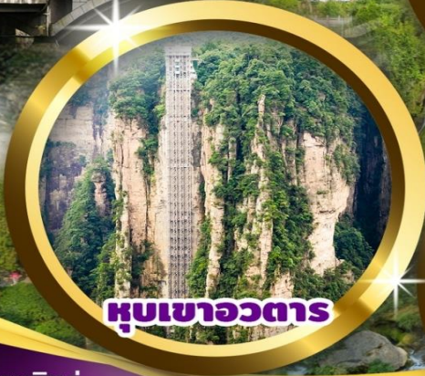
หุบเขาอวตาร