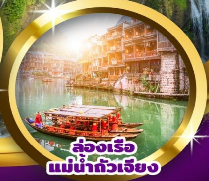
ล่องเรือ แม่น้ำถั่วเจียง