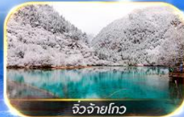
จิวเจียงโกว