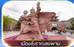
เมืองโบราณซ่งฟาน