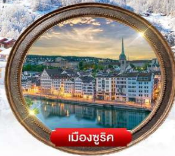
เมืองซูริก