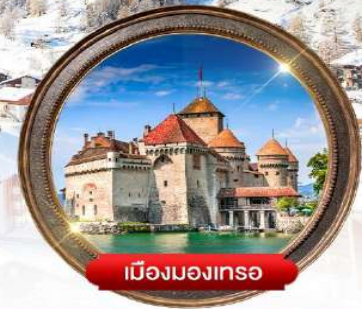
เมืองมงเทร