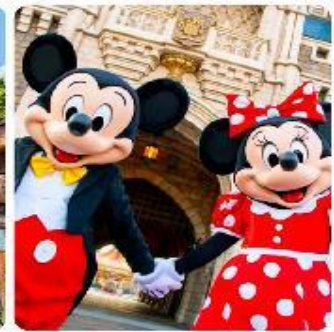
โตเกียวดิสนีย์แลนด์

แนะนำที่เที่ยว อิสระด้วยตัวเองเต็มวัน ! เลือกซื้อทัวร์เสริมอิสระดิสนีย์แลนด์ (ไม่มีหัวหน้าทัวร์และไม่มีไกด์นำเที่ยว) เอาใจแฟนพันธุ์แท้ของดิสนีย์ กับ สวนสนุกโตเกียวดิสนีย์แลนด์ ที่ได้สัมผัสประสบการณ์ความสนุกสนานในโลกแฟนตาซีเมื่อเดินทางเข้าสู่ สวนสนุกโตเกียวดิสนีย์แลนด์ จะพบกับธีมพาร์คที่ แบ่งออกเป็น หลากหลาย เช่น Adventureland ที่ได้สัมผัสประสบการณ์ในป่าและน้ำตก, Fantasyland ดินแดนของตัวละครดิสนีย์ที่คุณหลงใหล, และ Tomorrowland ที่จะพาคุณไปสำรวจอนาคตที่ได้สัมผัสไปด้วยนวัตกรรม นอกจากนี้เรายังเพลิดเพลินกับร้านอาหารและคาเฟ่รวมไปถึงของฝากจากดิสนีย์อีกมากมาย (ค่าทัวร์ยังไม่รวมบัตรค่าเช้า)