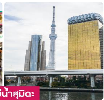
วัดอาซากุสะ | ถนนนากะมิสะ | โตเกียวสกายทรีแม่น้ำสุมิเดะ

กรุงโตเกียว วัดอาซากุสะ วัดอาซากุสะ หรือเซ็นโซจิ เป็นวัดเก่าแก่และมีชื่อเสียงที่สุดในโตเกียวใน ย่าน อาซากุสะ ภายในวัดมีรูปปั้นเจ้าแม่กวนอิม รวมถึงเจดีย์ห้าชั้น เมื่อเดินผ่านประตูคามินาริมงที่มีโคมแดงขนาดใหญ่ จะเจอกับ ถนนช้อปปิ้งนากะมิสะ (NAKAMISE SHOPPING) ถนนช้อปปิ้งที่มีประวัติยาวนานใน ย่านอาซากุสะ และเต็มไปด้วยร้านค้าขายของฝาก ขนมหวาน และสินค้าพื้นเมืองญี่ปุ่น ที่นี่เราสามารถพบกับสินค้าหลากหลายชนิด หากมีเวลาขอพาทุกท่านไปยังจุดชมวิวยุคใหม่ แม่น้ำสุมิเดะ (SUMIDA RIVER) ที่จะชวนให้เรารู้สึกเหมือน โตเกียวสกายทรี TOKYO SKY TREE พร้อมวิวทิวทัศน์ที่สวยงาม