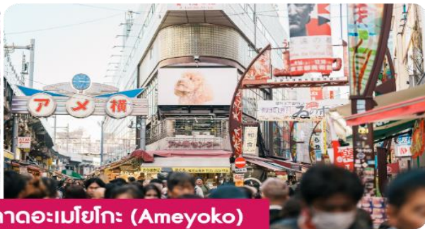
สวนอุเอโนะ Ueno Park | ตลาดอะเมโยโกะ (Ameyoko)

พาทุกท่านสู่ สวนอุเอโนะ (Ueno Park) สวนสาธารณะที่มีชื่อเสียงในกรุงโตเกียวมีสิ่งน่าสนใจมากมาย เช่น สวนสาธารณะ พื้นที่สีเขียวที่เหมาะสมแก่การเล่นและพักผ่อน มีพิพิธภัณฑ์ที่มีชื่อเสียง เช่น พิพิธภัณฑ์โตเกียวแห่งชาติ และพิพิธภัณฑ์ศิลปะอุเอโนะ มีสวนสัตว์อุเอโนะ สวนสัตว์เก่าแก่และมีสัตว์หลากหลายชนิด รวมถึงทะเลสาบชินจิ ซึ่งมีกิจกรรมเรือพายให้ทำ และชมวิวดูได้อย่างสวยงาม และสวนอุเอโนะยังเป็นจุดชมดอกซากุระที่สวยงามในช่วงฤดูใบไม้ผลิ ตลาดอะเมโยโกะ (Ameyoko) เป็นตลาดชื่อดังในย่านอุเอโนะ ตลาดแห่งนี้เต็มไปด้วยร้านค้าต่าง ๆ ทั้งขายอาหารสด อาหารแปรรูป เสื้อผ้า เครื่องสำอาง และของที่ระลึก รวมถึงสินค้าราคาถูกหลายประเภท ทำให้เป็นแหล่งช้อปปิ้งยอดนิยมทั้งสำหรับคนท้องถิ่นและนักท่องเที่ยว