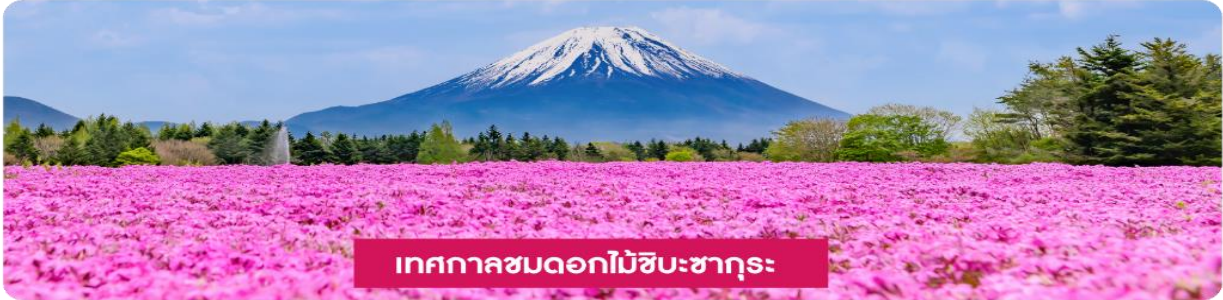
เทศกาลชมดอกไม้ชิบะซากุระ

เทศกาลชมดอกไม้ชิบะซากุระ (Shibazakura Festival) เป็นเทศกาลที่จัดขึ้นในช่วงฤดูใบไม้ผลิเดือนเมษายนถึงพฤษภาคม โดยที่มีการจัดแสดงดอกชิบะซากุระ (หรือที่เรียกว่า "ดอกไม้มอส") ที่บานเต็มทุ่งหญ้า ดอกชิบะซากุระจะมีสีสันหลากหลาย เช่น สีชมพู ม่วง ขาว และแดง ซึ่งถือเป็นไฮไลต์ของในช่วงเทศกาลนี้ และจะได้เห็นทุ่งดอกไม้ที่กว้างขวางที่เรียงรายไปตามเนินเขาบรรยากาศที่สวยงามพร้อมกิจกรรมต่าง ๆ ให้ผู้เข้าชมได้เพลิดเพลิน เช่น การเดินเล่นในสวน ถ่ายรูป และการเพลิดเพลินกับวิวทิวทัศน์ที่สวยงามของภูเขาและธรรมชาติ