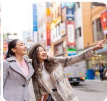
ช้อปปิ้งใจกลางกรุงโตเกียว