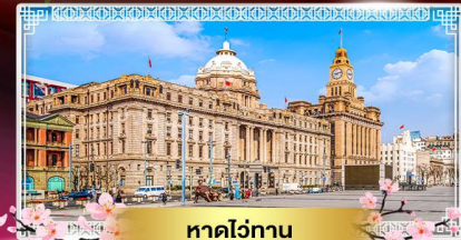
หาดไฉ่ทาน