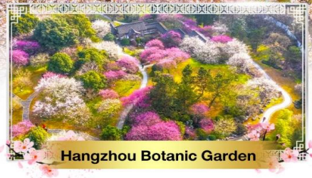
Hangzhou Botanic Garden