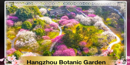
Hangzhou Botanic Garden