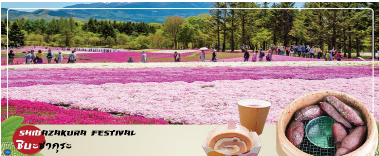
SHIBAZAKURA FESTIVAL ชิบะซากุระ