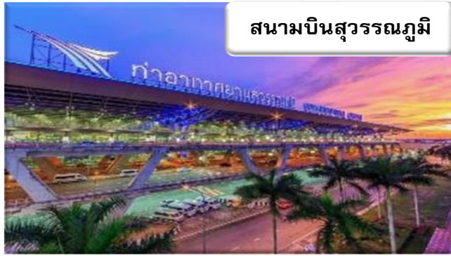
สนามบินสุวรรณภูมิ

เวลา 20.00 น. ร่วมกันที่ สนามบินสุวรรณภูมิ อาคารผู้โดยสารขาออกระหว่างประเทศเคาน์เตอร์ สายการบินไทยแอร์เวย์ เจ้าหน้าที่คอยให้การต้อนรับ ดูแลด้านเอกสาร เช็คอิน และสัมภาระในการเดินทาง