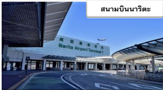
สนามบินนาริตะ

เวลา 06.20 น. เดินทางถึง สนามบินนาริตะ ประเทศญี่ปุ่น นำท่านผ่านขั้นตอนการตรวจคนเข้าเมืองและศุลกากร