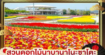
สวนดอกไม้บานานาโนะซาโตะ