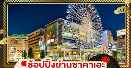
ช้อปปิ้งย่านซากาเอะ