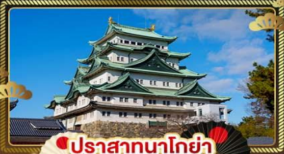
ปราสาทนาโกย่า