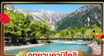
อุทยานคาบิโคจิ