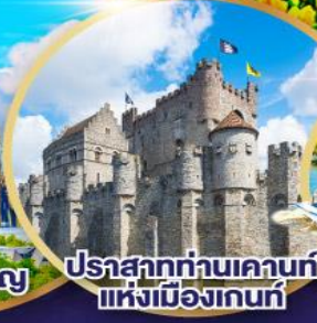
ปราสาทท่านเคานท์แห่งเมืองเกนท์