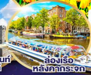
ล่องเรือหลังค้ำกระจก