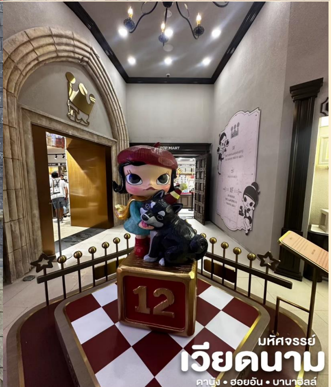
มัทศจรรย์ เวียดนาม ดานัง • ฮอยอัน • บานาฮิลล์

โซนใหม่ Eclipse Square ดินแดนแห่งเทพนิยาย ทางเข้าล้อมรอบด้วยประติมากรรม 20 องค์ของเทพธิดาที่มีชื่อเสียงที่สุดจากเทพนิยายกรีก ตามอธยาศัย และ พบกับ POP MART Ba Na Hills เป็นร้านค้าสาขาใหม่ที่ใหญ่ที่สุดในเอเชียตะวันออกเฉียงใต้ ตั้งอยู่ที่ Ba Na Hills เมืองดานัง ประเทศเวียดนาม เป็นศูนย์รวม Art Toy ที่เป็นกระแสอยู่ตอนนี้ ไม่ว่าจะ เป็น Molly,