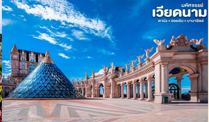
มัทศจรรย์ เวียดนาม ดานัง • ฮอยอัน • บานาฮิลล์