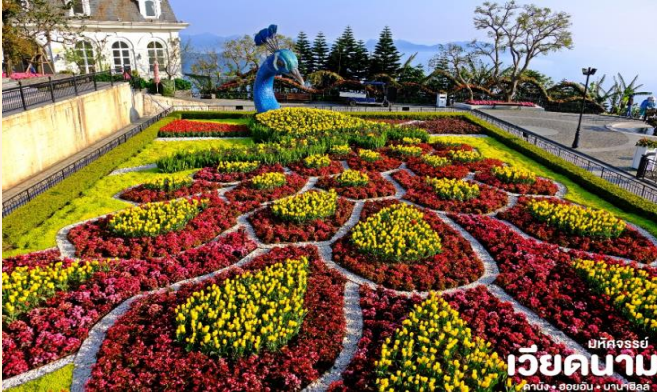
มัทศจรรย์ เวียดนาม ดานัง • ฮอยอัน • บานาฮิลล์

BT-DAD092_VZ_FEB-OCT 2025 DANANG HOIAN BANAHILLS (พักบานาฮิลล์)