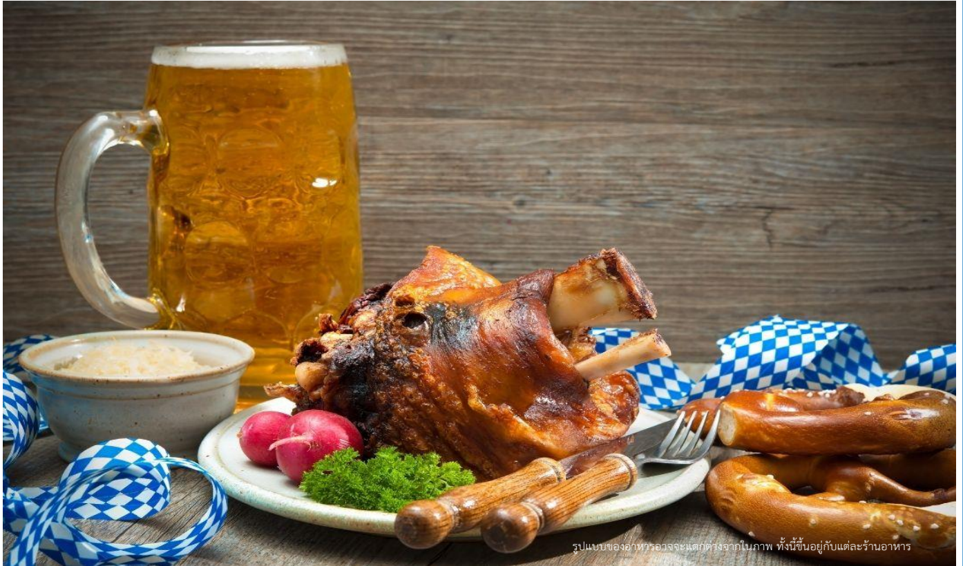
รูปแบบของอาหารอาจจะแตกต่างจากในภาพ ทั้งนี้ขึ้นอยู่กับแต่ละร้านอาหาร

จากนั้นนำท่านเข้าสู่ที่พัก 🏨 Mercure Hotel Muenchen Sued Messe หรือเทียบเท่า