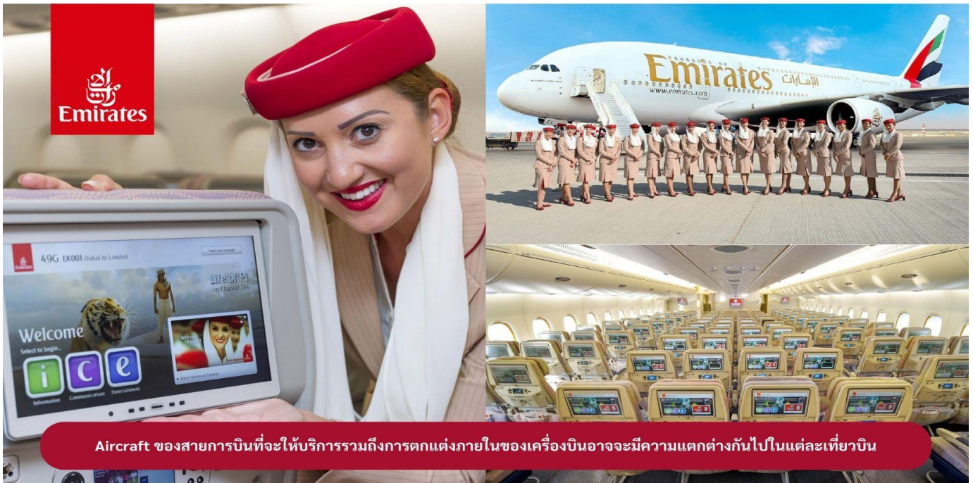
Aircraft ของสายการบินที่จะให้บริการรวมถึงการตกแต่งภายในของเครื่องบินอาจมีความแตกต่างกันไปในแต่ละเที่ยวบิน

22.00 น. !!!! ขณะเดินทางพร้อมกัน ณ สนามบินสุวรรณภูมิ อาคารผู้โดยสารขาออกระหว่างประเทศ ชั้น 4 ประตู 9 แถว T สายการบินเอมิเรตส์ แอร์ไลน์ (EK) เจ้าหน้าที่ให้การต้อนรับและอำนวยความสะดวก