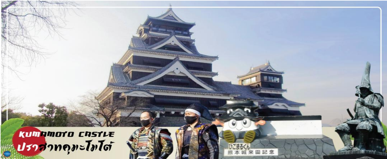
KUMAMOTO CASTLE ปราสาทคามาโมโตะ

วันที่สาม เมืองเบปปุ – เมืองคามาโมโตะ – ปราสาทคามาโมโตะ (เช้าชม) – เทศกาลชมดอกทิวลิปที่เรีย ณ ศาลเจ้าคามาโมโตะ หรือ ศาลเจ้าตะไซฟูเหมมังกุ – เมืองฟุกุโอกะ – ดิวตี้ฟรี – กันดั้ม ปาร์ค ฟุกุโอกะ