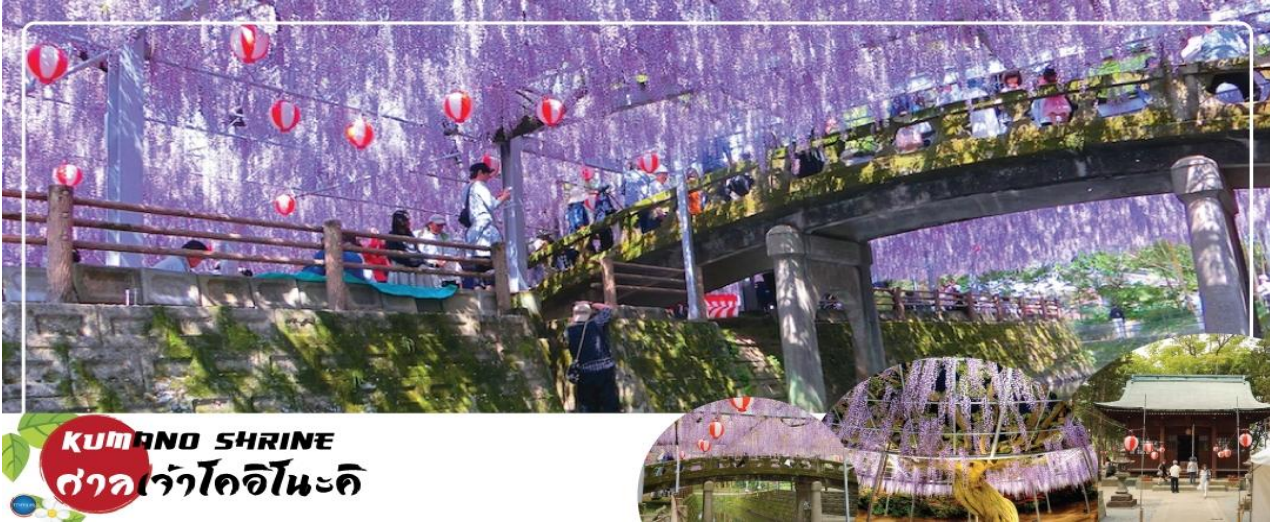
KUMANO SHRINE ศาลเจ้าโคอิโนะดะ

เที่ยง รับประทานอาหารกลางวัน ณ ภัตตาคาร (3)