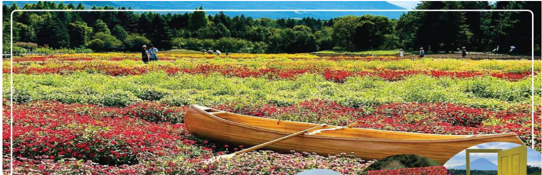
RAINBOW FLOWER FESTIVAL เทศกาลทุ่งดอกไม้ฟูจิ

หรือ ชม Rainbow Flower Festival 2025 (ปกติเทศกาลจะจัดช่วง ปลายเดือนสิงหาคม - ต้นเดือนตุลาคม ซึ่งกำหนดการปีนี้อยู่ไม่มีประกาศอย่างเป็นทางการ) สถานที่จัดงานบริเวณคาวากุจิโกะ เมืองแห่งภูเขาไฟฟูจิ เทศกาลดอกไม้เมืองร้อนที่มีชื่อเสียงของญี่ปุ่น ที่มีเพียงปีละครั้งเท่านั้น ภายในเทศกาลมีการจัดแสดงดอกไม้เมืองร้อนหลากหลายกว่า 10 ชนิด ไม่ว่าจะเป็น ดอกมิโกเนีย, ดอกซินเนียบ, ดอกซัลเวีย และดอกรัตเบเกีย นอกจากนี้ยังสามารถมองเห็นวิวของภูเขาไฟฟูจิได้อีกด้วย ภายในสวนมีจุดให้ถ่ายรูปมากมาย และยังมีสวนดอกไม้สไตล์อังกฤษที่มาพร้อมตัวละครมาสคอตสุดน่ารัก "Piter Rabbit English Gardent" และนอกจากนี้ยังมีคาเฟ่ไว้นั่งพักผ่อนชมวิวแบบชิๆอีกด้วย