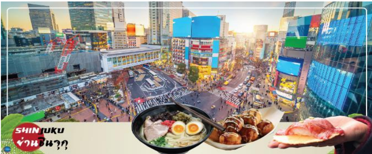
SHINJUKU ย่านชินจูกุ

นำท่านช้อปปิ้ง ย่านชินจูกุ (Shinjuku) ให้ท่านอิสระและเพลิดเพลินกับการช้อปปิ้งสินค้ามากมาย ทั้งเครื่องใช้ไฟฟ้า กล้องถ่ายรูปดีจิตอล นาฬิกา เครื่องเล่นเกม หรือสินค้าที่จะเอาใจคุณผู้หญิงด้วย กระเป๋า รองเท้า เสื้อผ้า แบรินต์เนม เสื้อผ้าแฟชั่นสำหรับวัยรุ่น เครื่องสำอางยี่ห้อดังของญี่ปุ่นไม่ว่าจะเป็น KOSE, KANEBO, SK II, SHISEDO และอื่นๆ อีกมากมาย ห้ามพลาด!!! จุดเช็คอินแห่งใหม่ ของชาวโซเชียล นั่นก็คือ แมวยักษ์ 3 มิติ ที่โผล่บนจอแอลอีดีมีขนาดมหึมา จอมีความโค้งขนาด 154 ตารางเมตร (1,664 ตารางฟุต) เสียงที่ออกจากลำโพงคุณภาพเกรดดี ความละเอียดภาพระดับ 4K ถือเป็นเทคโนโลยีระดับสูง ที่ให้ภาพเสมือนจริงปรากฏเป็นภาพแมวเหมียวเดินเล่นไปมาอยู่เหนือกรุงโตเกียว นอกจากแมวยักษ์แล้ว ท่านยังสามารถรับชมโฆษณาต่างๆ ที่ถูกครีเอทให้เป็นภาพ 3 มิติ ผ่านจอแอลอีดีนี้ ไม่ว่าจะเป็น แพนด้า, รองเท้าไนกี้, น้องหมา Pompompurin, จานบิน UFO แม้แต่หุ่นยนต์เครื่องดูดฝุ่น ท่านสามารถรับชมและเก็บภาพได้ตามอัธยาศัย