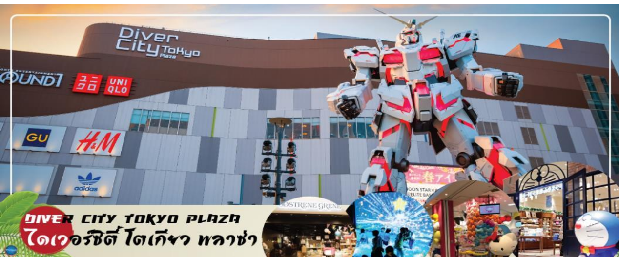
DIVER CITY TOKYO PLAZA ไดเวอร์ซิตี โตเกียว พลาซ่า

จากนั้นเดินทางสู่ ย่านโอไดบะ (Odaiba) เมืองคือเกาะที่สร้างขึ้นไว้เป็นแหล่งช้อปปิ้ง และแหล่งบันเทิงต่างๆ ในอ่าวโตเกียว ได้รับการปรับปรุงให้มีชื่อเสียงและเป็นที่นิยมในช่วงหลังของปี 1990 นอกจากนี้มีสถาปัตยกรรมที่สวยงามตั้งอยู่มากมายแล้ว แต่ก็ยังคงความเป็นธรรมชาติไว้ด้วยความอุดมสมบูรณ์ของพื้นที่สีเขียว ไดเวอร์ซิตี โตเกียว พลาซ่า (Diver City Tokyo Plaza) เป็นห้างดังอีกแห่งหนึ่ง ที่อยู่บนเกาะ โอไดบะ จุดเด่นของห้างนี้ก็คือ หุ่นยนต์กันดั้ม ขนาดเท่าของจริง ซึ่งมีขนาดใหญ่มาก ในบริเวณห้าง อิสระช้อปปิ้งตามอัธยาศัย