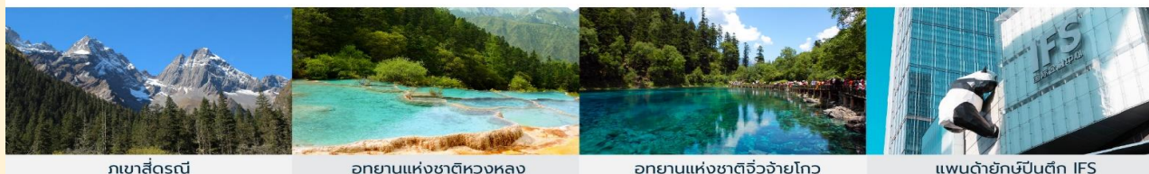
ภูเขาสี่ดรุณี อุทยานแห่งชาติหวงหลง อุทยานแห่งชาติจิวจ้ายโกว แพนด้ายักษ์ปิ่นตึก IFS