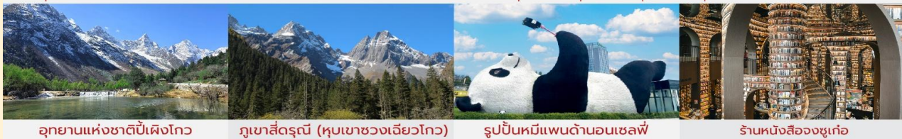
อุทยานแห่งชาติปี่ฝิงโกว