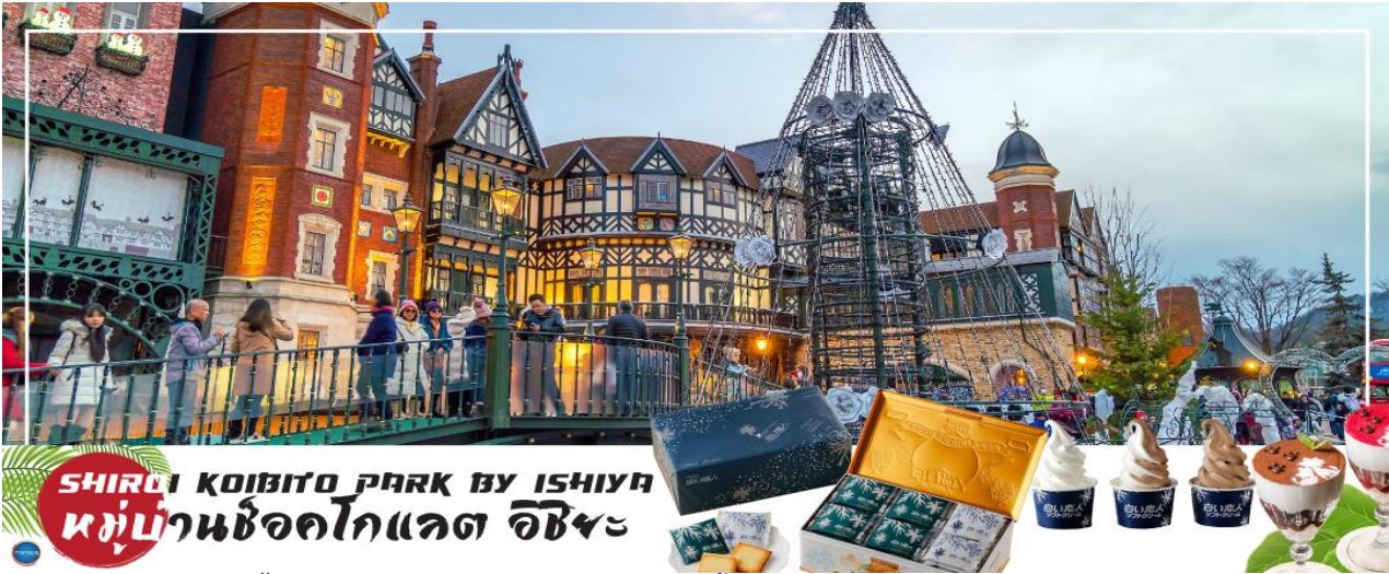
SHIROI KOIBITO PARK BY ISHIYA หมู่บ้านช็อคโกแลต อิชิยะ

โกแลตที่ขึ้นชื่อที่สุดของที่นี่คือ Shiroi Koibito ซึ่งมีความหมายว่าช็อคโกแลตขาวแต่คนรัก ท่านสามารถเลือกซื้อกลับไปให้คนที่ท่านรักทานหรือว่าซื้อเป็นของฝากติดไม้ติดมือกลับบ้านก็ได้ นอกจากนี้ท่านจะได้เลือกซื้อช็อคโกแลตที่หาซื้อที่ไหนไม่ได้ และ ท่านก็ยังจะได้ชมประวัติความเป็นมาของโรงงาน และการผลิตช็อคโกแลตอีกด้วย