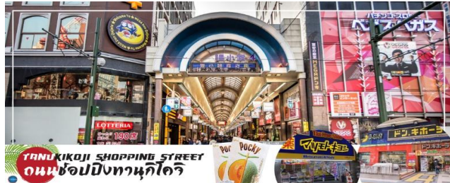
TANUKIKOJI SHOPPING STREET ถนนช้อปปิ้งทานุกิโคจิ

จากนั้นอิสระให้ท่านเดินเล่น ณ ถนนช้อปปิ้งทานุกิโคจิ (Tanukikoji Shopping Street) เป็นย่านการค้าเก่าแก่ของเมืองซัปโปโร โดยมีพื้นที่ทั้งหมด 7 บล็อก ภายนอกจากจะเป็นแหล่งรวมร้านค้าต่างๆ อย่างร้านขายกิโมโน เครื่องดนตรี วิดีโอ โรงภาพยนตร์แล้ว ยังมีร้านอาหารมากมาย ทั้งยังเป็นศูนย์รวมของเหล่าวัยรุ่นด้วย เนื่องจากมีเกมเซ็นเตอร์ และตู้หนีบตุ๊กตามากมาย ร้านดองกิ ร้าน 100 Yen นอกจากนี้ที่นี่ยังมีการตกแต่งบนหลังคาด้วยตุ๊กตาทานุกิขนาดใหญ่ และเนื่องจากร้านค้าส่วนใหญ่หลังคาคลุม ดังนั้น ไม่ต้องกังวลเรื่อง ฝนหรือหิมะ ท่านสามารถช้อปปิ้งได้อย่างเพลิดเพลิน