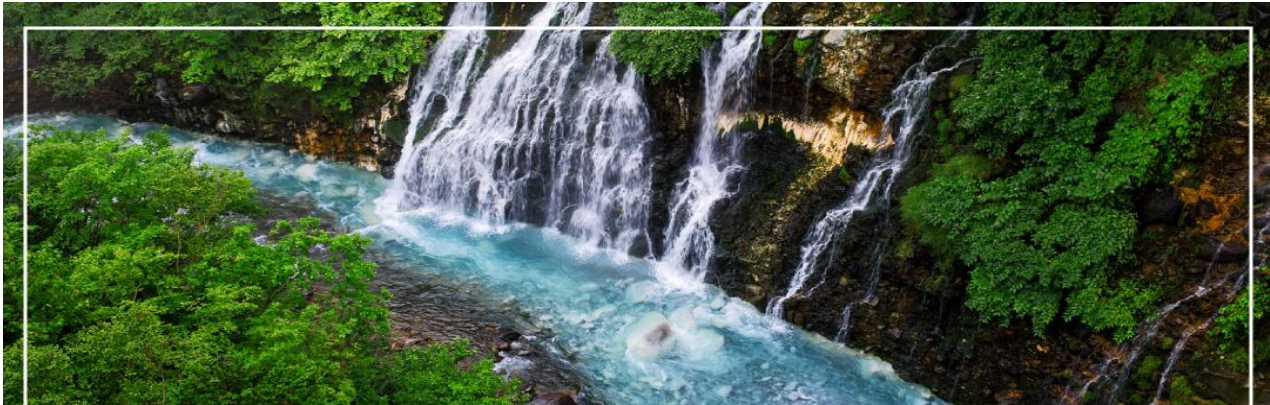
SHIRAHIGE WATERFALL น้ำตกชิราฮิเกะ

วันที่สอง ท่าอากาศยานนิชิโตเสะ สอกโกโด - เมืองบิเอะ - น้ำตกชิราฮิเกะ - สระอะโออิเคะ หรือ บ่อน้ำสีฟ้า - เมืองอาซาฮิดาวา - อีออน อาซาฮิดาวา