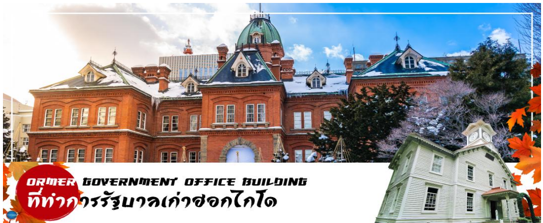
FORMER GOVERNMENT OFFICE BUILDING ที่ทำการรัฐบาลเก่าซอกไกโด

จากนั้น ผ่านชม หอนาฬิกาเมืองซัปโปโร (Sapporo Clock Tower หรือภาษาญี่ปุ่นเรียกว่า Sapporo Tokeidai) เป็นหอนาฬิกาโบราณมีลักษณะเป็นอาคารไม้ที่มีหลังคาสีแดงและผนังสีขาว ถูกออกแบบและบริจาคให้โดยรัฐบาลสหรัฐอเมริกา ในปี ค.ศ. 1878 เป็นสัญลักษณ์ทางวัฒนธรรมและประวัติศาสตร์ของเมืองซัปโปโร สำหรับหอนาฬิกาถูกติดตั้งในปี ค.ศ. 1881 จากบริษัท E. Howard & Co. เมือง Boston และในปี ค.ศ. 1970 หอนาฬิกาแห่งนี้ถูกกำหนดให้เป็นทรัพย์สินทางวัฒนธรรมที่สำคัญแห่งชาติ อีกด้วย