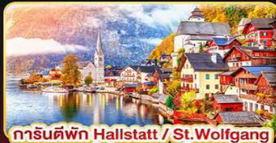
การ์นต์ฟัท Hallstatt / St. Wolfgang หรือริมทะเลสาบ 1 คืน