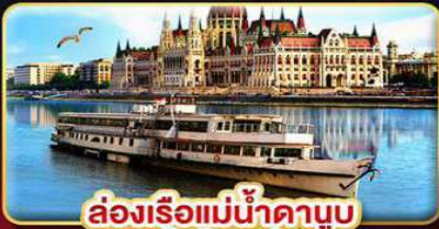
ล่องเรือแม่น้ำดานูบ พร้อมจิบแชมเปญ