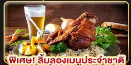
พิเศษ! ลิ้มลองเมนูประจำชาติ ทั้ง 5 ประเทศ!!!