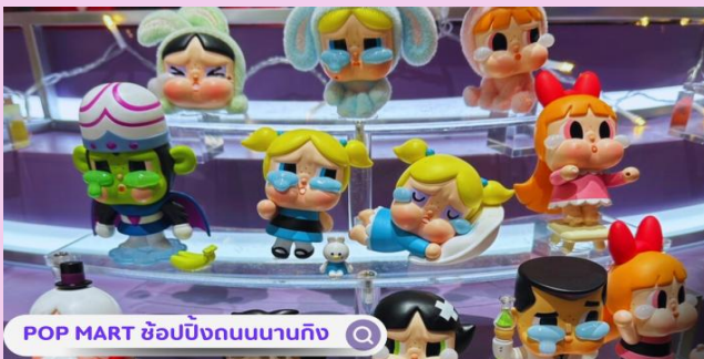
POP MART ซ้อป๊อปกันนานกิง

นำท่านสู่บริเวณ หาดไวทาน (WAITAN) ซึ่งไม่ได้เป็นหาดทรายชายทะเลแต่อย่างใด แต่เป็นย่านถนนริมแม่น้ำที่มีความยาว 1.5 กิโลเมตร ไปตามริมแม่น้ำหวงผู่ฝั่งตะวันตกซึ่งอยู่ในย่านเมืองเก่า หาดไวทานยังคงเคยเป็นสถานที่ถ่ายทำภาพยนตร์ที่โด่งดังเรื่อง "เจ้าพ่อเซี่ยงไฮ้"