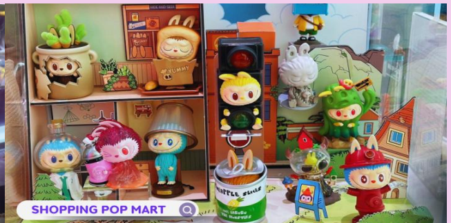
SHOPPING POP MART