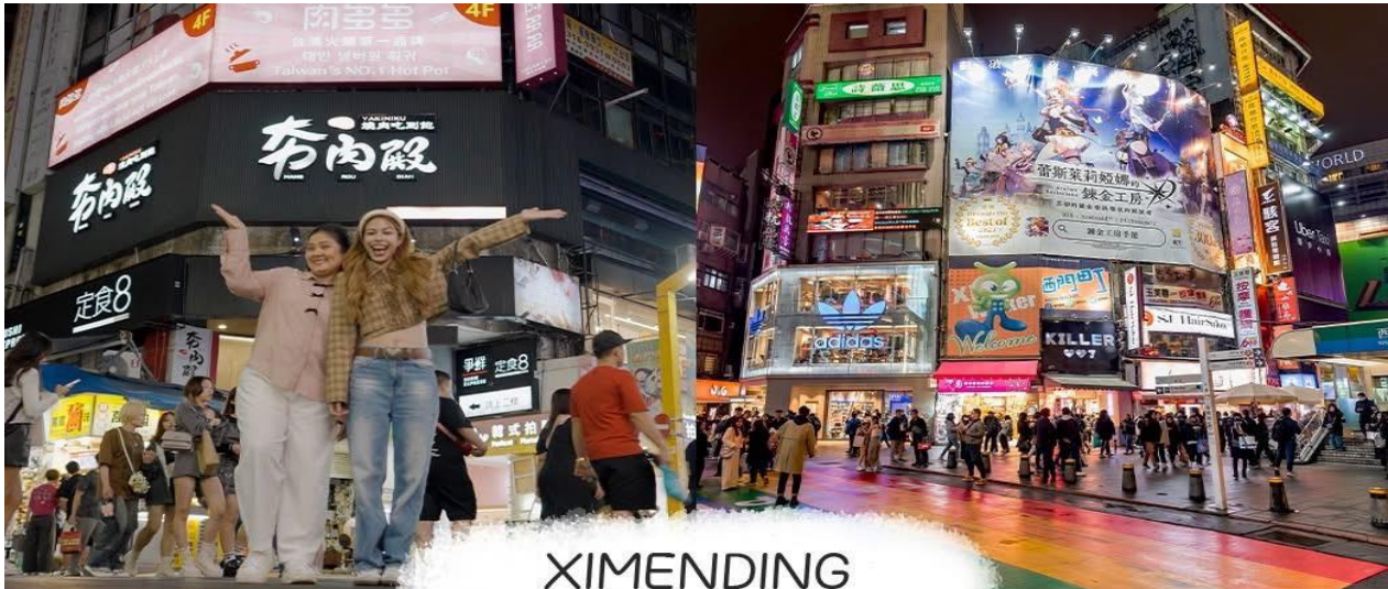
XIMENDING ย่านซีเหมินติง

BT-TPE26_SL TAIPEI อิสระ 1 วัน APR-SEP25