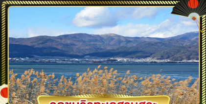
จุดชมวิวกะเลสาบสุระ