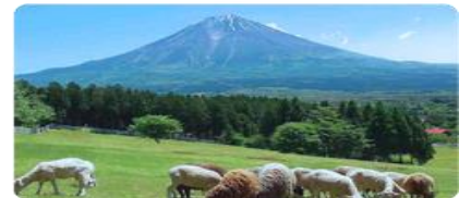
ภาพใช้ประกอบการโฆษณา