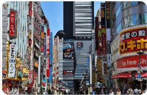
ช้อปปิ้งใจกลางกรุงโตเกียว - ชิบุจุกุ

นำพาทุกท่านเข้าสู่.. กรุงโตเกียว และช้อปปิ้งกันที่ใจกลางเมือง ชิบุจุกุ แหล่งรวมแฟชั่นและความบันเทิงย่านที่ไม่เคยหลับไหลและเต็มไปด้วยชีวิตชีวา และแหล่งช้อปปิ้งที่หลากหลาย เช่น Isetan และ Takashimaya ที่มีสินค้าหรูหราและแฟชั่นล่าสุด รวมถึงห้างสรรพสินค้าในตึกสูงอย่าง Tokyo Metropolitan Building เพลิดเพลินกับบรรยากาศที่สว่างไสวของ Kabukicho ซึ่งเป็นย่านบันเทิงที่มีร้านอาหารมากมาย นอกจากนี้ยังมี Golden Gai ซึ่งเป็นย่านบาร์เล็กๆ ที่มีเสน่ห์และบรรยากาศที่เป็นเอกลักษณ์ และมีแลนด์มาร์คถ่ายรูปที่โด่งดังอย่าง แมวยักษ์ 3 มิติ (Giant 3D Cat)