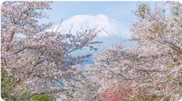
หมู่บ้านน้ำใสโอชิโนะ ฮักโก

โอชิโนะ ฮักโก หรือ ที่รู้จักกันในชื่อ หมู่บ้านน้ำใส ความงามแห่งธรรมชาติและวัฒนธรรมที่ซ่อนอยู่ใต้เงากุเขาไฟฟูจิโอชิโนะ ฮักโก ตั้งอยู่ในหมู่บ้านโอชิโนะ จังหวัดยามานาชิ ประเทศญี่ปุ่น เป็นแหล่งน้ำธรรมชาติที่มีชื่อเสียง ประกอบด้วยบ่อน้ำใสสะอาดทั้งแปดแห่ง ซึ่งน้ำในบ่อเหล่านี้เกิดจากการละลายของหิมะและน้ำแข็งจากกุเขาไฟฟูจิ น้ำที่ไหลลงมานั้นได้ถูกกรองผ่านชั้นหินภูเขาไฟเป็นเวลาหลายปี จนทำให้น้ำในบ่อมีความบริสุทธิ์และใสจนเห็นถึงก้นบ่อ ไม่เพียงแต่ความงามของธรรมชาติที่ทำให้โอชิโนะ ฮักโกเป็นที่รู้จัก แต่ยังมีชื่อเสียงก่อบัณฑิตและประวัติศาสตร์ท้องถิ่นอย่างลึกซึ้ง หมู่บ้านนี้เป็นสถานที่