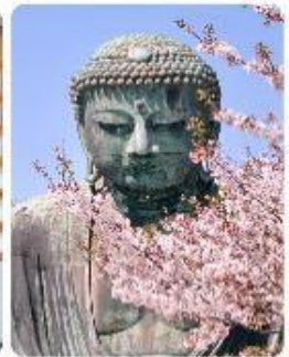
พระใหญ่ไดบุทสึ วัดโคโตคุอิน

จุดเด่นแห่งเมืองนี้คือ พระพุทธรูปองค์ใหญ่ไดบุทสึ (Daibutsu) หนึ่งในสัญลักษณ์ที่โดดเด่นที่สุดของ Kamakura พระพุทธรูปบронซ์ขนาดมหึมาที่วัดโคโตคุอิน (Kotoku-in) ที่มีความสูง 13.35 เมตร หนึ่งในพระพุทธรูปที่ใหญ่ที่สุดในญี่ปุ่น ไฮไลท์ของที่นี่คือการได้ชมความงามที่ตัดกันระหว่างพระพุทธรูปไดบุทสึขนาดใหญ่และต้นซากุระ ซึ่งปลูกอยู่ทั้งด้านหน้าและด้านหลังของพระพุทธรูป ทำให้เหมาะอย่างยิ่งกับการเดินเล่นและชมซากุระในบริเวณวัด เป็นอีกหนึ่งสถานที่ที่ต้องมาเยือนสักครั้ง หนึ่งในจุดไฮไลท์ของเมืองคามาคุระ คือ ไม้ไผ่กันพายุเย็น เกาะเอโนะชิมะ (Enoshima) เป็นเกาะที่ตั้งอยู่ในจังหวัดคานากาวะ ประเทศญี่ปุ่น ซึ่งเป็นจุดหมายท่องเที่ยวยอดนิยมที่มีทัศนียภาพที่สวยงามและสถานที่ที่น่าสนใจมากมาย ทั้งชายหาด สวน และวิวทะเลที่งดงาม ในวันที่ท้องฟ้าโปร่งใสเรายังสามารถมองเห็นวิวของภูเขาไฟฟูจิได้อีกด้วย ด้านบนยังมี ศาลเจ้าเอโนชิมะ ที่มีความสำคัญในด้านความโชคดี โดยเฉพาะในเรื่องความรัก นอกจากนี้ยังมี หอคอยประภาคารเอโนชิมะ ที่ให้ทัศนียภาพ 360 องศา ของเมืองคามาคุระได้อีกด้วย