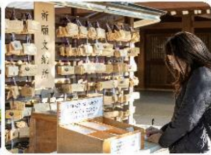
ศาลเจ้าเมจิจิงกู

ศาลเจ้าเมจิ หนึ่งในสถานที่อันศักดิ์สิทธิ์ใจกลางกรุงโตเกียว สิ่งแรกที่จะทำให้คุณประทับใจคือการเดินผ่านเสาโทริอิขนาดใหญ่ ระหว่างทางมีธรรมชาติที่ทำให้รู้สึกเหมือนก้าวเข้าสู่อีกโลกหนึ่งที่เต็มไปด้วยความสงบ อีกทั้งยังสามารถเขียนคำอธิษฐานลงบนแผ่นไม้ "เอมะ" เพื่อขอพรสำหรับความสุขและความสำเร็จในชีวิตอีกด้วย จากนั้นนำพาทุกท่าน...ซ้อปปิ้งกันต่อใจกลางกรุงโตเกียว เมืองที่เป็นศูนย์กลางของแฟชั่นและนวัตกรรม และเปิดประสบการณ์การช้อปปิ้งที่ไม่เหมือนใคร! สํารวจย่านต่างๆ ทีแต่ละแห่งที่มีเสน่ห์และเอกลักษณ์อันโดดเด่น เมืองที่เต็มไปด้วยชีวิตชีวาและความทันสมัยที่หลากหลายอย่าง ย่านฮาราจุกุ แหล่งรวมแฟชั่นที่แปลกใหม่และสดใส เดินเล่นบน Takeshita Street ที่เต็มไปด้วยเสื้อผ้าและเครื่องประดับที่ไม่ซ้ำใคร เพลิดเพลินกับบรรยากาศสุดคูลที่เป็นเอกลักษณ์