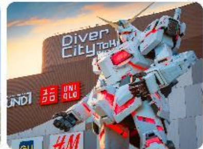
ย่านโอไดบะ ห้างไดเวอร์ซิตี ODAIBA SEASIDE PARK