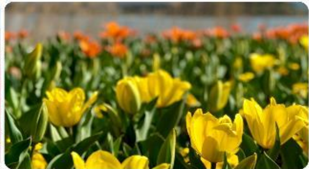
สวนโออิชิ ปาร์ค

สวนดอกไม้โออิชิ ปาร์ค (Oishi Park) มหัศจรรย์แห่งวิวกุเขาไฟฟูจิ หนึ่งในจุดชมวิวกุเขาไฟฟูจิที่สวยงามที่สุดอีกจุดหนึ่ง ที่จะเติมเต็มความสงบและความงดงามของธรรมชาติในญี่ปุ่นเมื่อไปเยือน คือสถานที่ที่ไม่ควรพลาด สวนดอกไม้โออิชิ ปาร์ค (Oishi Park) แห่งนี้ไม่ได้เป็นเพียงสถานที่ที่มีดอกไม้สวยงามให้เราได้ชื่นชมแล้ว จุดเด่นของสวนนี้คือวิวกุเขาฟูจิที่อยู่เบื้องหลังสวนดอกไม้สีแสนสดใส ที่บานสะพรั่งในทุกฤดูกาล และยังเป็นมุมที่ให้เราได้สัมผัสกับวิวกุเขาฟูจิได้อย่างใกล้ชิด จากนั้นนำพาทุกท่านสู่..