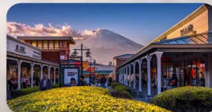
โทเกียวะ