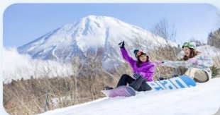
Fujiten Snow Resort