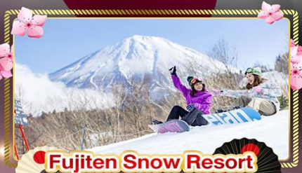
Fujiten Snow Resort