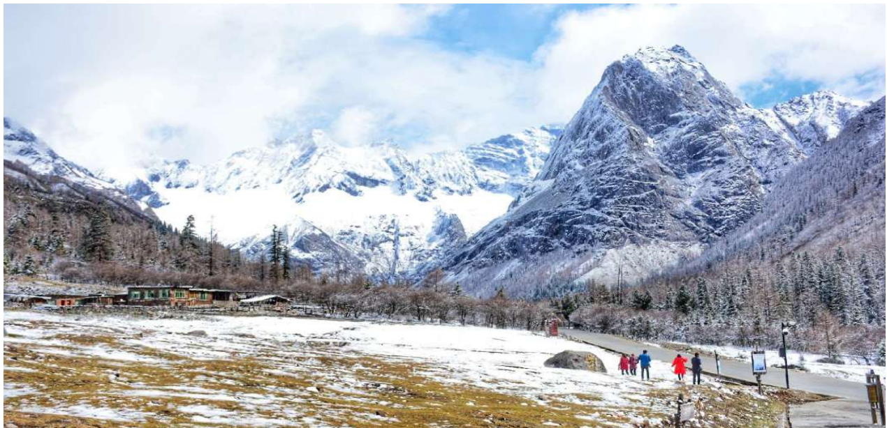
T2G-TFU21SL SPECIAL CHENGDU... ซีดรุงี ปีเผิงโกว พระใหญ่เล่อซาน 6D 5N (SL) ไม่ลงร้านรัฐบาล

ชมความงามระดับโลกของ ภูเขาซีดรุงี ภูเขาหินใหญ่โตที่มีลักษณะที่สูงชัน ด้านบนยอดเขาถูกปกคลุมไปด้วยหิมะขาวโพลนตลอดทั้งปี มองดูเหมือนหญิงสาวที่ปกคลุมหน้าด้วยผ้าขาว ตั้งตำนานของสี่สาวพี่น้อง คือ ต้ากุเหนียงซาน เออร์กูเหนียงซาน ซานกุเหนียงซาน และชื่อกูเหนียงซาน บริเวณตีนเขานั้นจะถูกปกคลุมไปด้วยผืนป่าอันอุดมสมบูรณ์ มีธารน้ำใสที่ไหลผ่าน และมีสายลมเย็นพัดผ่านทุ่งหญ้าและผืนป่า จนทำให้ความสวยงามของภูเขาซีดรุงีมีความสวยงามเหมือนกับยุโรปตอนใต้ ทำให้ที่นี่ได้รับการขนานนามว่า "เทือกเขาแอลป์แห่งดินแดนตะวันออก" ซึ่งความสวยงามของภูเขาซีดรุงีจะเปลี่ยนแปลงไปตามฤดูกาล (รวมรถอุทยานแล้ว)