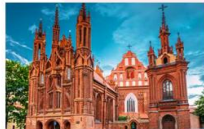
โบสถ์เซนต์แอน