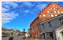
Kaunas Old Town

** พักที่ Holiday Inn Vilnius Hotel 4* หรือเทียบเท่า **