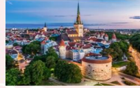
Tallinn Old Town