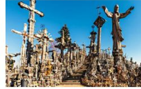
Hill of Crosses