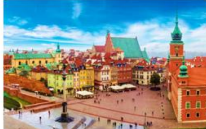
จัตุรัสเมืองเก่า