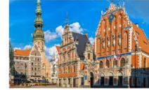
เมืองริกา

** พักที่ Bellevue Park Hotel Riga 4* หรือเทียบเท่า **