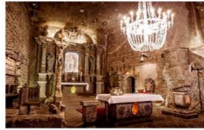
เหมืองเกลือวิลิชกา

** พักที่ Golden Tulip Krakow Hotel 4* หรือเทียบเท่า **