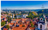
Vilnius Old Town