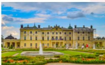
พระราชวัง Branicki