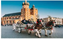
Krakow Old Town

05.15 น. เดินทางถึงสนามบินอิสตันบูล แวะเปลี่ยนเครื่อง 07.25 น. ออกเดินทางสู่สนามบินคราคูฟ เที่ยวบิน TK1271 08.45 น. เดินทางถึงสนามบินคราคูฟ ประเทศโปแลนด์