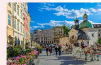
เมืองครากูฟ

** พักที่ Golden Tulip Krakow Kazimierz Hotel 4* หรือเทียบเท่า **