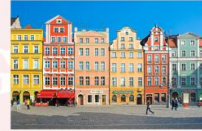
เมืองวรอดซวาฟ