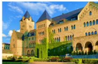
ปราสาทอิมพีเรียล

** พักที่ Vivaldi Hotel 4* หรือเทียบเท่า **