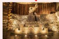
เหมืองเกลือวิลิซก้า