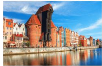
เมืองกตังส์