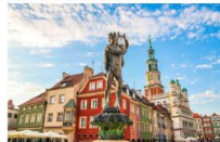
เมืองโปซนัน