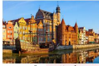
เมืองกตังส์