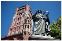
เมืองโตรุน