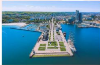
เมืองกตึเนีย