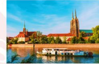
ล่องเรือชมเกาะทัมสกี

** พักที่ HP Plaza Hotel 4* หรือเทียบเท่า **