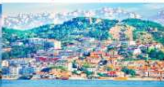
หมู่บ้านชาวประมงซาจื่อโข่ว