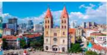
โบสถ์คริสต์เซนต์โมเคิล

*ทางบริษัทฯ ขอสงวนสิทธิ์ในการสลับโปรแกรมทัวร์ตามความเหมาะสมขึ้นอยู่กับสถานการณ์หน้างาน โดยคำนึงถึงผลประโยชน์ของลูกค้าเป็นสำคัญ