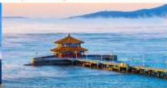
สะพานจันเจียว