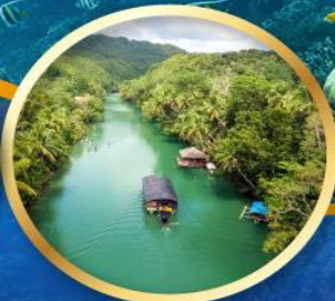
ล่องเรือแม่น้ำไลบ็อก