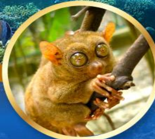
ลิงการ์เซีย