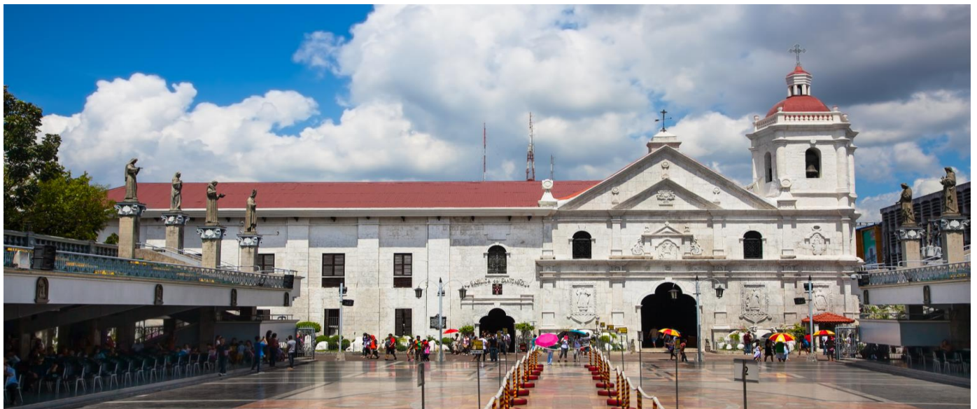
นำท่านชม โบสถ์ซานโตนิโญ (Basilica Minore del Santo Nino) โบสถ์ที่เก่าแก่ที่สุดของ

GO1CEB-5J102 CEBU Mabuhay Sea. Sand. Smile. ดำน้ำชมฉลามวาฬ เกาะโบโฮล 4วัน2คืน โดยสารการบิน Cebu Pacific (5J)