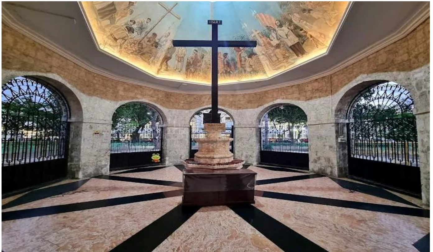
บ่าย นำท่านชม กางเขนโบราณมาเจลลัน (Magellan's Cross) ตั้งอยู่บนจัตุรัสซูกโบ ภายในประดิษฐานไม้กางเขนศาสนาคริสต์ที่นักสำรวจชาวโปรตุเกสและสเปนนำมาปักไว้เมื่อปี ค.ศ. 1521 เป็นสัญลักษณ์แห่งประวัติศาสตร์ยุคอาณานิคมของเซบู