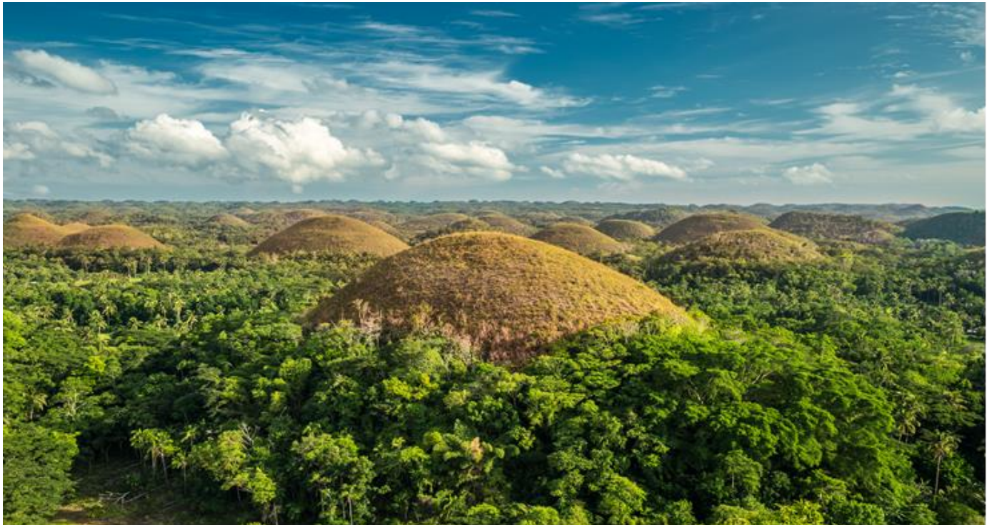
GO1CEB-5J102 CEBU Mabuhay Sea. Sand. Smile. ดำน้ำชมฉลามวาฬ เกาะโบโฮล 4วัน2คืน โดยสารการบิน Cebu Pacific (5J)

นำท่านเดินทางสู่ท่าเรือเซบู ขึ้นเรือเฟอร์รี่ความเร็วสูงไปยังเกาะโบโฮล (ใช้เวลาประมาณ 2 ชั่วโมง)