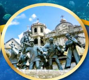
อนุสาวรีย์มรดกแห่งเซบู