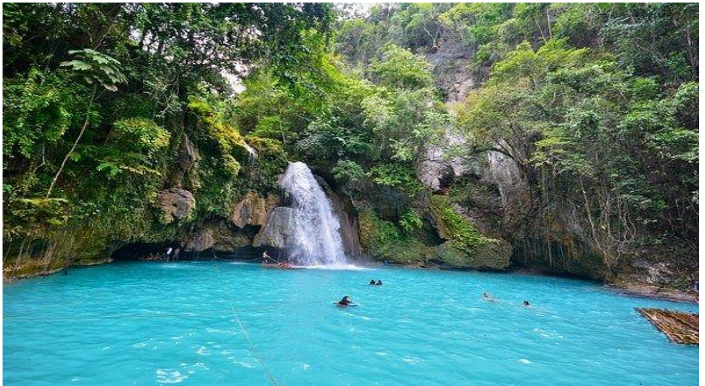
GO1CEB-5J102 CEBU Mabuhay Sea. Sand. Smile. ดำน้ำชมฉลามวาฬ เกาะโบโฮล 4วัน2คืน โดยสารการบิน Cebu Pacific (5J)