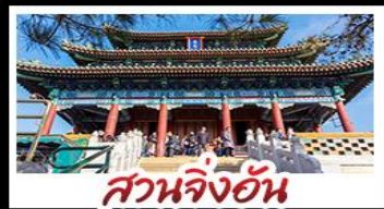
สวนจิ้งอัน