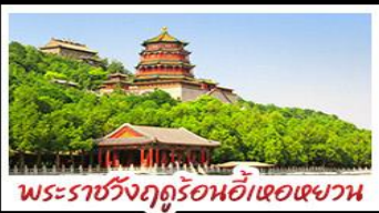
พระราชวังฤดูร้อนอี้เหอหยวน

ท่าอากาศยานจีนด่านจวิงกวน - พระราชวังฤดูร้อนอี้เหอหยวน สวนจิ้งอัน - วัดลามะ - ไม่หลงร้านช้อปปิ้ง - โรงแรม 4 ดาว มื้อพิเศษ เปิดปีกถึง สุก๊ิมองโกเลีย MICHELIN GUIDE ร้าน TAO TAO JU