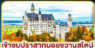
เข้าชมปราสาทนอยชวานสไตน์

คัดสรรความเป็น "ที่สุด" ของยุโรปตะวันออกครบถ้วน