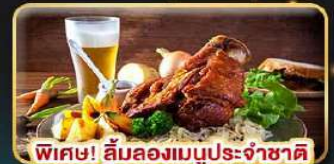
พิเศษ! ลิ้มลองเมนูประจำชาติ ทั้ง 5 ประเทศ!!!