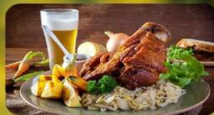
พิเศษ! ลิ้มลองเมนูประจำชาติ ทั้ง 5 ประเทศ!!!