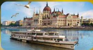
สองเรือแม่น้ำดานูบ พร้อมจิบแชมเปญ