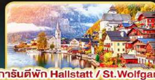
การันตีพัก Hallstatt / St. Wolfgang หรือริมทะเลสาบ 1 คืน