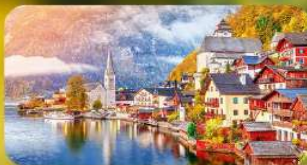
การ์นต์ฟัก Hallstatt / St. Wolfgang หรือริมทะเลสาบ 1 คืน