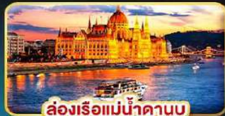
ล่องเรือแม่น้ำดานูบ ช่วง Twilight