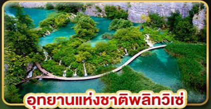
อุทยานแห่งชาติพลิตวิเช