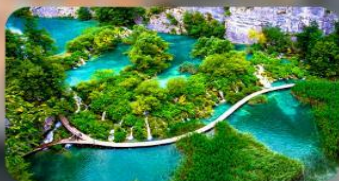
อุทยานแห่งชาติพริตวิเซ่