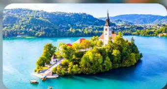
โบสถ์พระแม่มาเรียแห่งเบลค