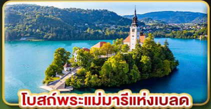
โบสถ์พระแม่มาเรียแห่งเบลด