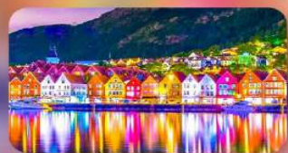
พักเบอเก้น 1 คืน