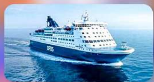
พักบนเรือสำราญ แบบ Window Room 1 คืน