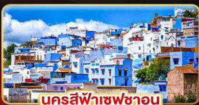
นครสีฟ้าเซฟซาอูน

เที่ยวเมืองสีฟ้าสุดชิค สัมผัสเสน่ห์ยุโรปได้ ครบทั้งประวัติศาสตร์และจุดถ่ายรูปสวยระดับโลก