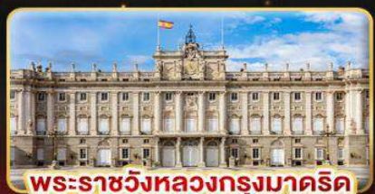
พระราชวังหลวงกรุงมาดริด