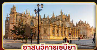
อาสนวิหารเซบิยา