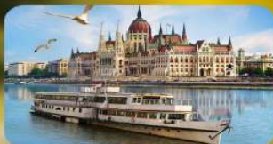
ล่องเรือแม่น้ำดานูบ พร้อมจิบแชมเปญ