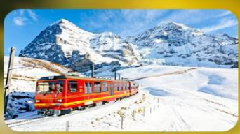
พิชิตยอดเขาจุงเฟรา