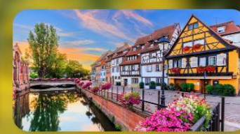
ดินแดนแห่งเทพนิยาย กอลมาร์