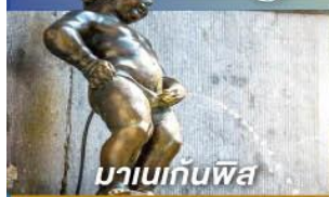
มานเนกันพิส