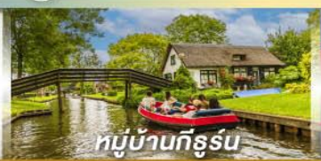
หมู่บ้านทึร์รูน