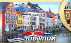
เมืองกันต์