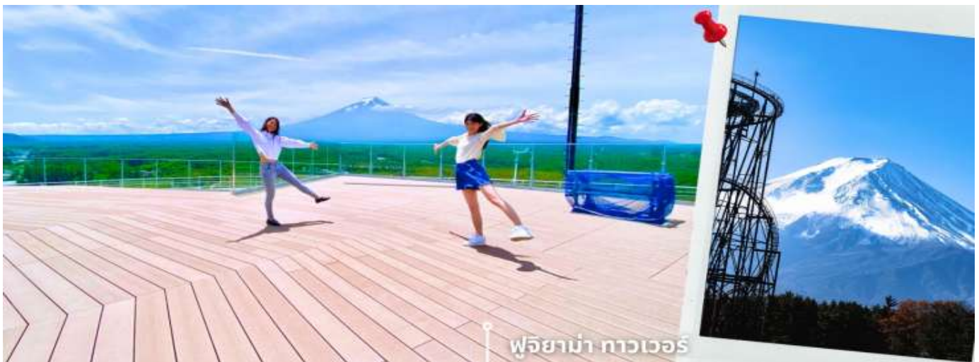
**การมองเห็นภูเขาไฟฟูจิ ขึ้นอยู่กับสภาพอากาศ**

หลังรับประทานอาหารเที่ยง นำท่านเดินทางสู่ หอคอยชมวิวกุจิมายามา ทาวเวอร์ จังหวัดยามานาชิ เป็นหอคอยที่สร้างอยู่ภายในรถไฟเหาะ มีความสูงถึง 55 เมตร จึงทำให้เป็นจุดชมวิวที่ให้ท่านได้สัมผัสธรรมชาติและภูเขาไฟฟูจิได้อย่างใกล้ชิดในมุมมองที่แปลกใหม่ ภายในทาวเวอร์มีจุดชมวิวแบบพาโนรามา สามารถมองเห็นภูเขาไฟฟูจิและทิวทัศน์โดยรอบได้อย่างชัดเจน ทั้งยังมีโซนกิจกรรมและมุมถ่ายภาพที่ออกแบบให้ใกล้ชิดกับธรรมชาติ สร้างประสบการณ์ที่ทั้งตื่นเต้นและน่าประทับใจ ให้ท่านอิสระถ่ายภาพตามอัธยาศัย