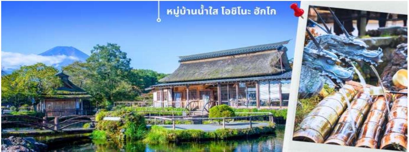
หมู่บ้านน้ำใส โอชิโนะ อักโก

จากนั้นท่านเดินทางสู่ จังหวัดชิซุโอกะ Shizuoka เป็นจังหวัดในประเทศญี่ปุ่น ตั้งอยู่ในภูมิภาคชูบุ บนเกาะฮอน มีพื้นที่ยาวตามแนวชายฝั่งมหาสมุทรแปซิฟิก จังหวัดนี้เป็นที่ตั้งของภูเขาฟูจิและมีชื่อเสียงของการปลูกชาเขียวที่ดีที่สุดญี่ปุ่น นำท่านเดินทางช้อปปิ้งที่ โกเทมบะ พรีเมียม เอ้าท์เล็ต Gotemba premium outlet อยู่ที่ฮาโกเน่ (Hakone) ได้ชื่อว่าเป็น Outlet ที่ใหญ่ที่สุดในญี่ปุ่น มีทั้งสินค้าแบรนด์ในประเทศและแบรนด์ต่างประเทศ มีร้านค้ากว่า 200 ร้าน และศูนย์อาหาร ภายในมีร้านค้าต่างๆหลากหลายแบรนด์ ไม่ว่าจะเป็นเสื้อผ้าแฟชั่น อุปกรณ์กีฬา เครื่องใช้ในครัวเรือน และสินค้าอิเล็กทรอนิกส์ แบรนด์ก็จะมีทั้ง Adidas, Alexander McQueen, Alexander Wang, Balenciaga, Birkenstock, Burberry, Bvlgari, Cath Kidston, Celine, G-Shock, Gucci, Issey Miyake, Kate Spade New York, Nike, Ralph Lauren, Ray-Ban, Saint Laurent และแบรนด์อื่น ๆ อีกมากให้ท่านได้ อิสระช้อปปิ้งตามอัธยาศัย