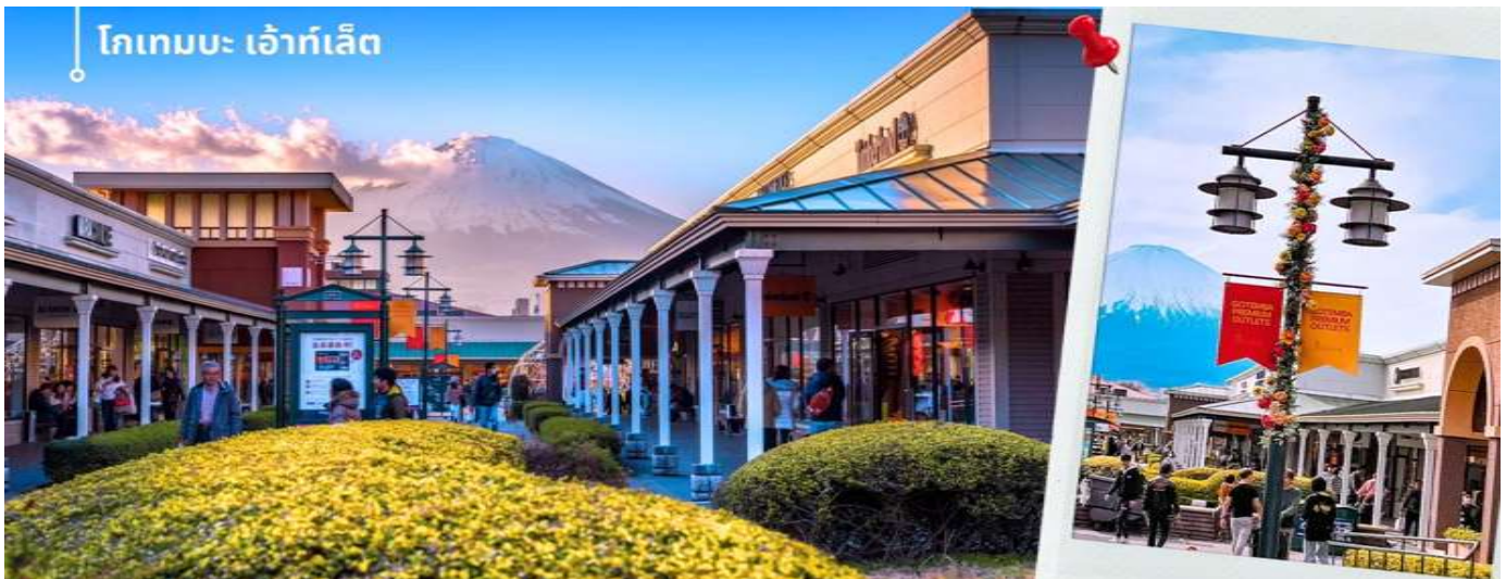
โกเทมบะ เอ้าท์เล็ต

จากนั้นท่านเดินทางสู่ จังหวัดชิซุโอกะ Shizuoka เป็นจังหวัดในประเทศญี่ปุ่น ตั้งอยู่ในภูมิภาคชูบุ บนเกาะฮอน มีพื้นที่ยาวตามแนวชายฝั่งมหาสมุทรแปซิฟิก จังหวัดนี้เป็นที่ตั้งของภูเขาฟูจิและมีชื่อเสียงของการปลูกชาเขียวที่ดีที่สุดญี่ปุ่น นำท่านเดินทางช้อปปิ้งที่ โกเทมบะ พรีเมียม เอ้าท์เล็ต Gotemba premium outlet อยู่ที่ฮาโกเน่ (Hakone) ได้ชื่อว่าเป็น Outlet ที่ใหญ่ที่สุดในญี่ปุ่น มีทั้งสินค้าแบรนด์ในประเทศและแบรนด์ต่างประเทศ มีร้านค้ากว่า 200 ร้าน และศูนย์อาหาร ภายในมีร้านค้าต่างๆหลากหลายแบรนด์ ไม่ว่าจะเป็นเสื้อผ้าแฟชั่น อุปกรณ์กีฬา เครื่องใช้ในครัวเรือน และสินค้าอิเล็กทรอนิกส์ แบรนด์ก็จะมีทั้ง Adidas, Alexander McQueen, Alexander Wang, Balenciaga, Birkenstock, Burberry, Bvlgari, Cath Kidston, Celine, G-Shock, Gucci, Issey Miyake, Kate Spade New York, Nike, Ralph Lauren, Ray-Ban, Saint Laurent และแบรนด์อื่น ๆ อีกมากให้ท่านได้ อิสระช้อปปิ้งตามอัธยาศัย