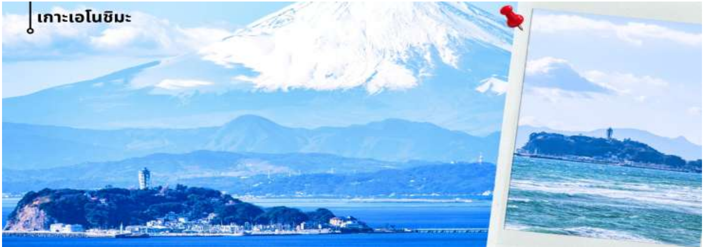
** การมองเห็นฟูเขาไฟฟูจิขึ้นอยู่กับสภาพอากาศ **

เช้า รับประทานอาหารเช้าที่ โรงแรม (3) หลังรับประทานอาหารเช้า นำท่านแวะชม พิพิธภัณฑน์แผ่นดินไหว เป็นพิพิธภัณฑน์ที่แสดงถึงผลกระทบจากภัยพิบัติแผ่นดินไหวและการระเบิดของภูเขาไฟ ภายในพิพิธภัณฑน์มีห้องจัดแสดงข้อมูลการประทุของภูเขาไฟจากทุกมุมโลก โชนความรู้ต่างๆและโชนข้อป้ังสินค้าญี่ปุ่นอาทิเช่น ผลิตภัณฑ์เครื่องสำอางและของฝากอีกมากมาย จากนั้นนำท่านเดินทางสู่ เกาะเอโนชิมะ ผ่านสะพานเอโนชิมะ เบนเท็น ซึ่งเป็นเส้นทางเชื่อมระหว่างแผ่นดินใหญ่กับตัวเกาะระหว่างทางสามารถชมบรรยากาศของท้องทะเลและวิวชายฝั่งได้อย่างเพลิดเพลิน และในวันที่อากาศแจ่มใสยังสามารถมองเห็นภูเขาไฟฟูจิได้จากระยะไกลอีกด้วย