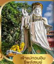
เจ้าแม่กวนอิม ธิวส์ลันยี่