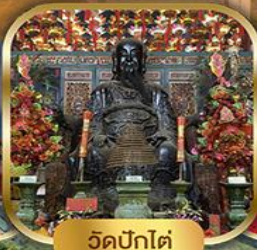
วัดปุกโต