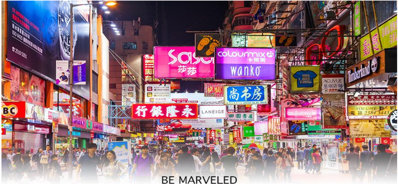
BE MARVELED TSIM SHA TSUI

เย็น ๑๐ อาหารเช้าเย็น เพื่อความสะดวกในการช้อปปิ้ง