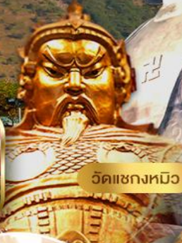
วัดเซกตหมิว