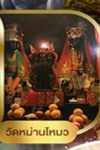
วัดบ้านใหม่