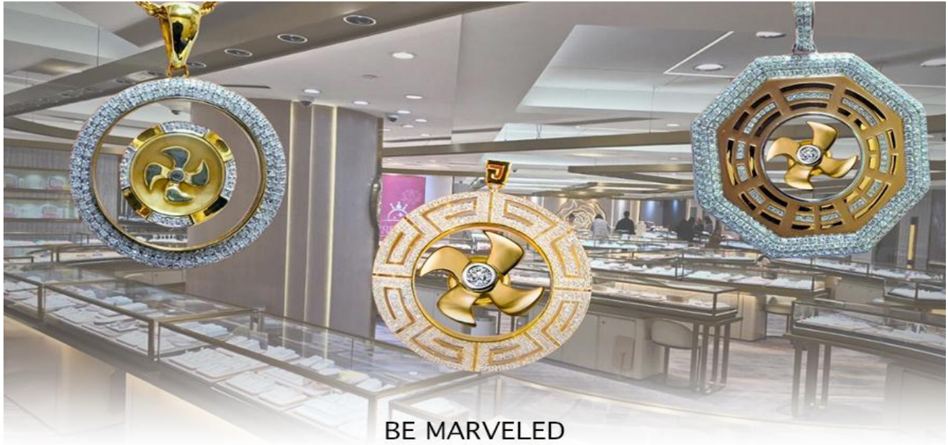
BE MARVELED ศูนย์ฮวงจุ้ย กัณฑ์เศรษฐี

และนำท่านชม ศูนย์ปีเซี่ยะ ซึ่งคนจีนนั้น ถือว่าหยกเป็นหิน ที่เป็นตัวแทนของความสวยงามและความบริสุทธิ์มีความเชื่อว่าหยก มงคล ถ้าพกติดตัวไว้จะอายุยืนและสุขภาพดีมีสินค้าน่ามากมายเกี่ยวกับหยก อาทิ กำไลหยก หรือสัตว์นำโชคอย่างปีเซี่ยะ ให้ท่านได้เลือกซื้อเป็นของฝาก, ของที่ระลึก หรือของนำโชคแต่ตัวท่านเอง