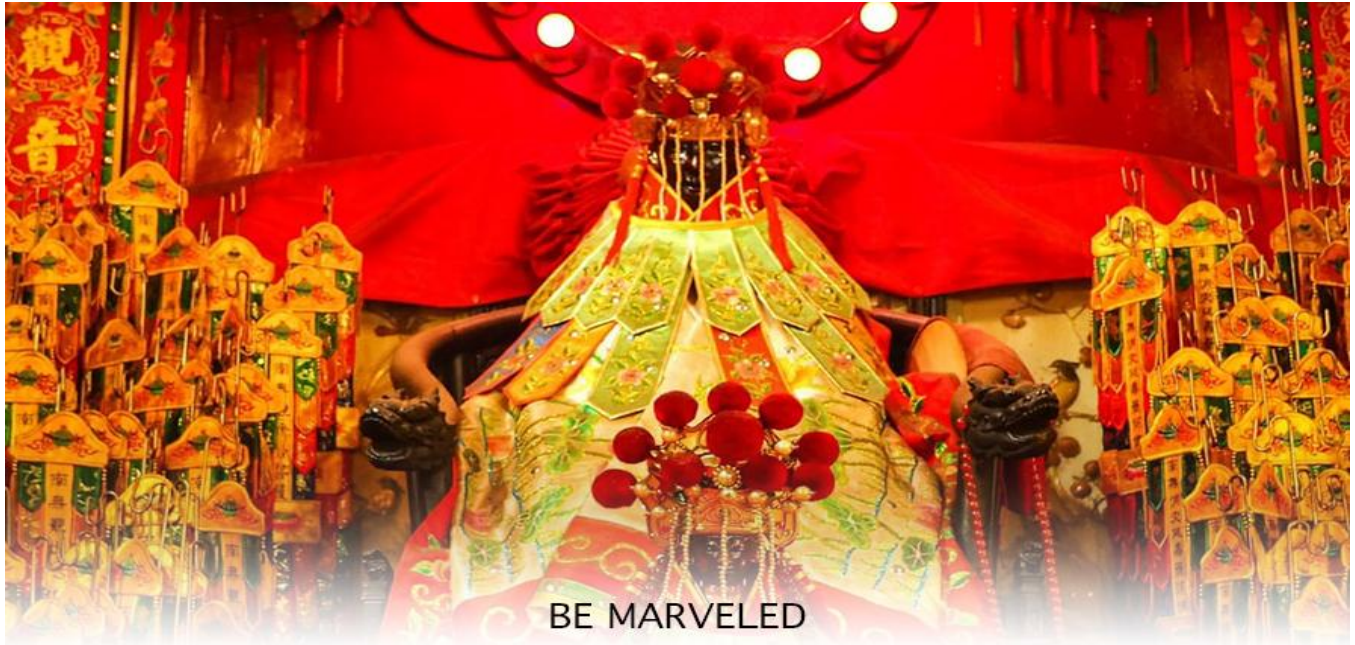
BE MARVELED วัดเจ้าแม่กวนอิมฮ่องกง (ยืมเงิน)

ลงบริเวณใกล้กับวัดแห่งนี้หลายต่อหลายครั้ง ทำให้มีผู้บาดเจ็บและล้มตายเป็นจำนวนมาก แต่ชาวบ้านที่หนีเข้าไปหลบภัยในวัดนี้กลับปลอดภัยอย่างปาฏิหาริย์ และตัววัดก็ไม่ได้ได้รับความเสียหายจากเหตุการณ์ที่ระเบิดอย่างน่าอัศจรรย์ ตามความเชื่อของคนจีนในฮ่องกง-มาเก๊า จะมี "วันเปิดทรัพย์" หรือ "พิธียืมเงิน เจ้าแม่กวนอิมฮ่องกง" เป็นวันที่จะมาขอพรและยืมเงินเจ้าแม่กวนอิมซึ่งนับจากหลังวันตรุษจีน ไป 26 วัน จะเป็นวันเปิดทรัพย์ที่จัดขึ้นในทุกๆปี พิธีนี้มีเพียงครั้งปีละครั้งเท่านั้น เป็นวันสำคัญอีกวันที่คนหลังไหลมาไหว้ขอพรอย่างไม่ขาดสาย