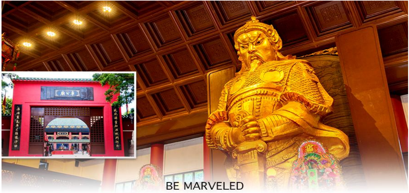
BE MARVELED วัดแขก

เที่ยง 📍 รับประทานอาหารเที่ยง ที่ภัตตาคาร