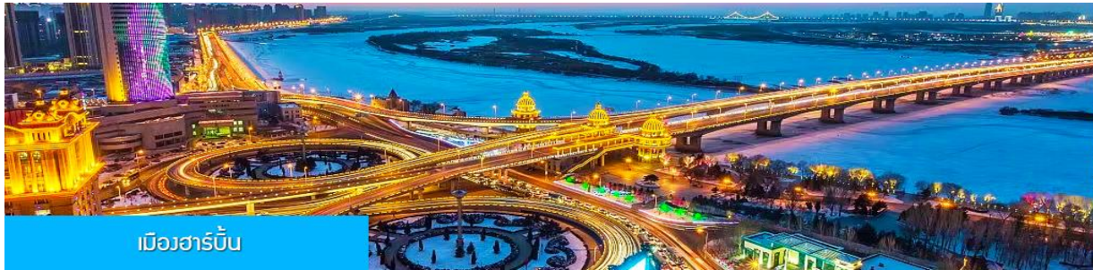
เมืองฮาร์บิน

หลังอาหารนำท่านเดินทางสู่ เมืองฮาร์บิน 哈尔滨市 (ระยะทาง 250 กม. ใช้เวลาเดินทางราว 3 ชั่วโมงเศษ) เมืองฮาร์บินเป็นเมืองที่ตั้งอยู่ทางตอนเหนือของจีนที่มีพรมแดนติดกับประเทศรัสเซีย เป็นเมืองเอกของมณฑลเฮยหลงเจียง มีสมญานามว่าเป็นกรุงมอสโกตะวันออก และได้ชื่อว่าเป็นเมืองหลวงแห่งฤดูหนาวเนื่องจากเมืองแห่งนี้มีช่วงฤดูหนาวยาวกว่าฤดูร้อน มีเทศกาลแกะสลักน้ำแข็งนานาชาติจัดขึ้นที่เมืองนี้ในช่วงฤดูหนาวของทุกปี เป็นจุดหมายปลายทางสำหรับนักท่องเที่ยวทั้งในและต่างประเทศที่ชื่นชอบความสวยงามของหิมะในฤดูหนาว