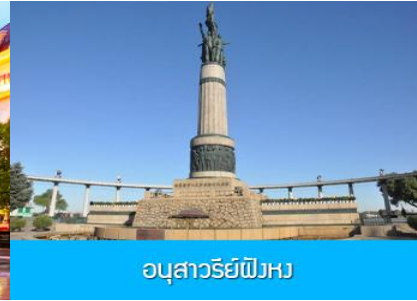
อนุสาวรีย์พิงหว

หลังอาหารนำท่านชม โบสถ์ เซนต์โซเฟีย 索菲亚教堂 (ชมด้านนอก) อีกหนึ่งสัญลักษณ์ที่โดดเด่นของเมืองฮาร์บิน สร้างขึ้นในปี ค.ศ. 1907 เป็นโบสถ์คริสต์นิกายออร์ทอดอกซ์ ที่ใหญ่ที่สุดในเอเชียตะวันออกเฉียงใต้ แสดงถึงอิทธิพลของวัฒนธรรมรัสเซียที่มีต่อเมืองฮาร์บิน