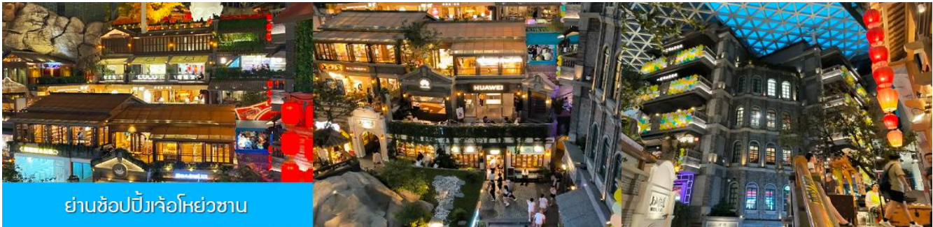
ย่านช้อปปิ้งเจ้อห่วยซาน

นำท่านเที่ยวชม ย่านช้อปปิ้งเจ้อห่วยซาน 这有山 แหล่งช้อปปิ้งขึ้นชื่อที่ผสมผสานระหว่างสถานที่ท่องเที่ยว และแหล่งรวมร้านค้า และร้านอาหารฟาสต์ฟู้ด อาหารพื้นเมืองร่วมสมัย ภายใต้คอนเซ็ปต์ แหล่งช้อปปิ้งบนภูเขา และบนภูเขามีย่านช้อปปิ้ง เป็นจุดเช็คอินยอดนิยมที่เปิดให้คนพื้นที่และนักท่องเที่ยวเข้าชมตั้งแต่ปี ค.ศ. 2019