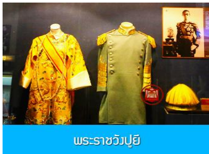
พระราชวังปู้ยี้

เช้า รับประทานอาหารเช้า ณ ห้องอาหารของโรงแรม (7)