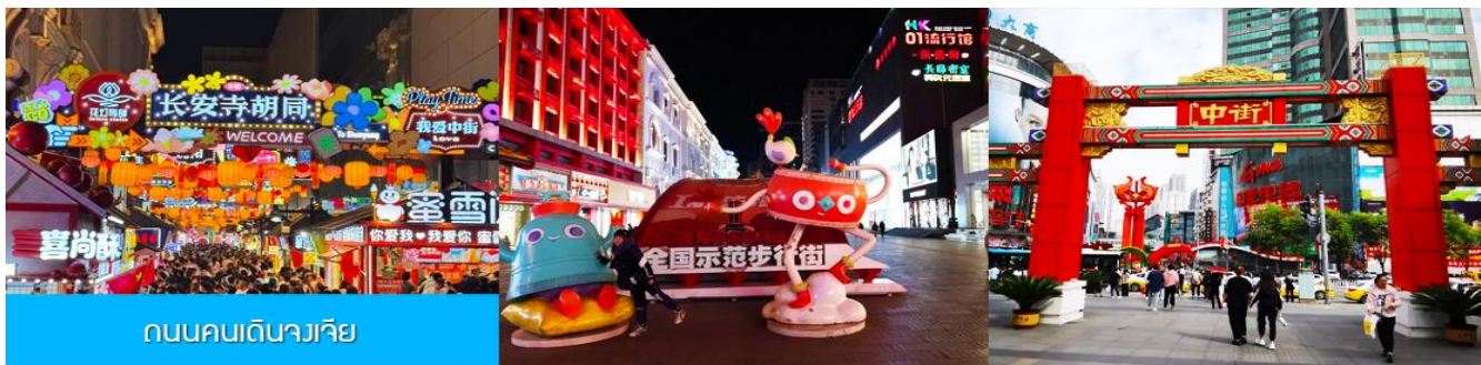
ถนนคนเดินจงเจีย

จากนั้นนำท่านเดินทางสู่ เมืองเสิ่นหยาง 沈阳市