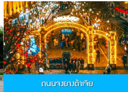
ถนนจงยงตู้