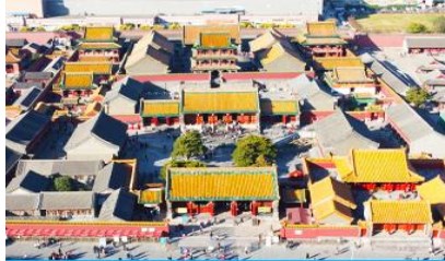
พระราชวังโบราณเสิ่นหยาง

เช้า รับประทานอาหารเช้า ณ ห้องอาหารของโรงแรม (4)