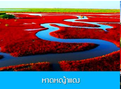
หาดหญ้าแดง

09.17 น. นำท่านขึ้นรถไฟความเร็วสูงขบวนที่ G047 (09.17/12.37) เพื่อเดินทางไปยังเมืองผานจิน มณฑลเถียนหยาง 12.37 น. ขบวนรถไฟนำท่านเดินทางถึงสถานีรถไฟเมืองผานจิน นำท่านเดินทางโดยรถบัสกักตุนอาหาร เที่ยง รับประทานอาหารกลางวัน ณ กักตุนอาหาร (2)