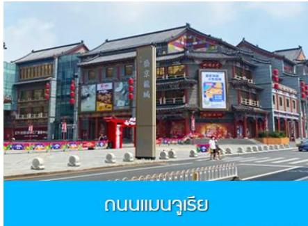
ถนนแมนจูเรีย